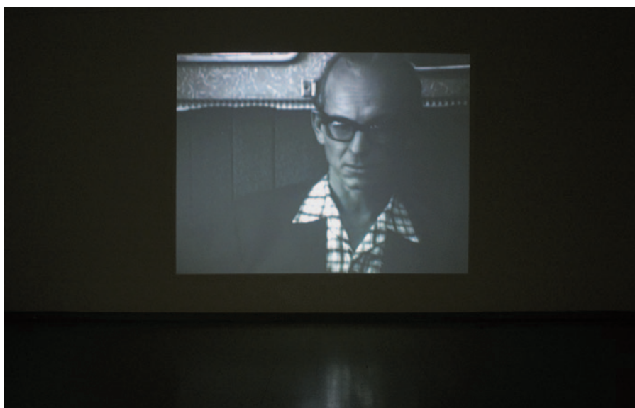
ESTERHÁZY MARCELL Feketén-fehéren, videó, 4:00