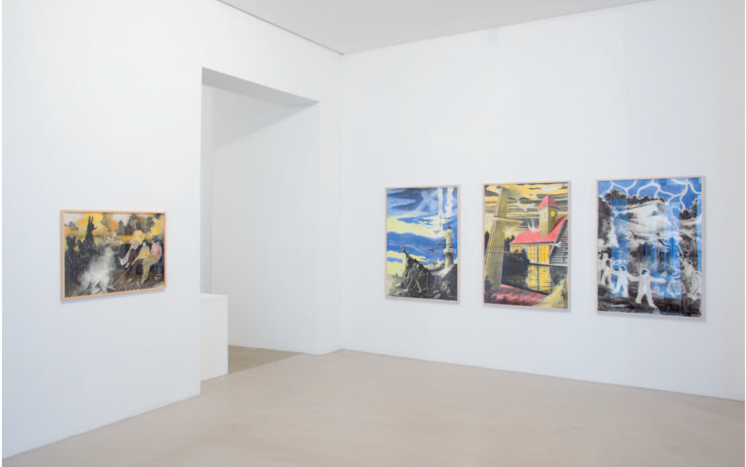
TILO BAUMGÄRTEL Ganz Ohr , Galerie Christian Ehrentraut, Berlin 2010. április 10 – június 5., részlet a kiállításról

Valójában egész egyszerű a folyamat: kivagdosom a fotókat, kézzel csinálók sok mindent, nem géppel.