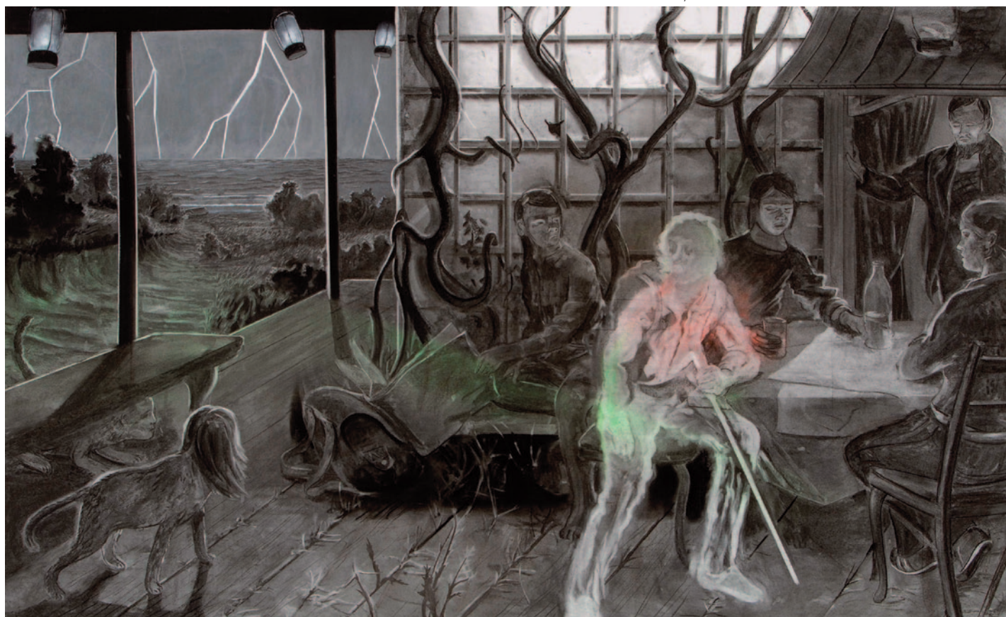
TILO BAUMGÄRTEL Világítótorony, 2006, szén, akril papíron, 150 × 250 cm

⊗ Gyakran vannak filmes ötleteim és bosszantana, ha nem tudnám a rajzaim és a festményeim statikusságát filmben „megmozgatni”. Tudtam, hogy ezt valamikor ki kell próbálnom. Olykor látok rövid filmszekvenciákat, amelyeket jónak találok és melyek nem mennek ki a fejből. Na jó, kipróbálok én is – gondoltam. Jó módszer arra, hogy elmeséljek valamit, laza formája a dokumentálásnak. Először technikailag kellett magamat képezni. Ez itt például egy fényképezőgép, amit közvetlenül a számítógéphez tudok kapcsolni. Amikor filmet készítek, fotókat vágok ki. Filmötleteim vannak, nem konkrét forgatókönyveim, így végül is egy olyan folyamatról van szó, amelynek az eredményeképpen a kivágott fotókból jön létre a mű; afféle videoklipeknek is tekinthető munkákat készítek. Mostanában minden olyan tökéletes, számítógéppel szimulált, ezért dolgozom fotóval.