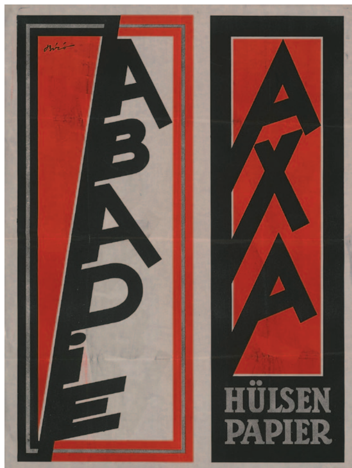
BÍRÓ MIHÁLY Abadie Axa, 1923, litográfia

Bíró életművében élesen elkülönül egy a húszas évek első felében keletkezett plakátcsoporthoz, amely a reklámplakátok sajátos ellentmondásait viseli magán. A fogyasztási cikkek ( Mem 1921, Abadie 1923), illetve magának a konzumálásnak ( Bécsi Nemzetközi Vásár 1922) a reklámozása – a kordivatnak megfelelően – a legújabb tipográfiai elemekkel történik, amelyek sajátos, monumentalizált formában jelennek meg. Ezeknek a munkáknak az esetében a harmincas évek nemzetközileg meghatározó stílusa, a német, olasz és szovjet képzőművészetre jellemző modernisztikus és ugyanakkor monumentális formamegoldások vetítik itt előre árnyékukat, ahol az absztrakt jelek (itt az építészeti elemként kezelt betűk) között elveszik az anonim – jellemző módon tömegként megjelenő – ember.