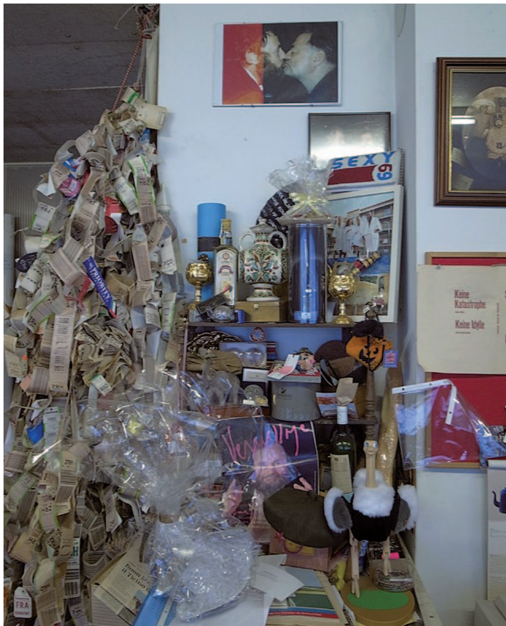
A Fabbrica Rosa, Harald Szeemann archívuma

Az egykori galvanizáló üzem, a „Fabbrica”, ahogy Szeemann nevezte, háromszáz négyzetméter alapterületű, amely két emeleten nyolc termet