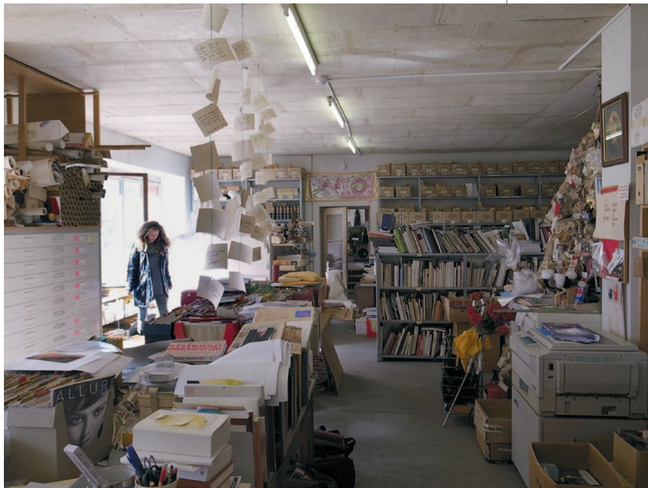
A Fabbrica Rosa, Harald Szeemann archívuma