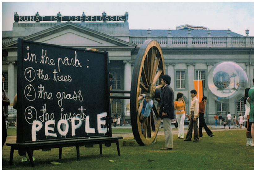
documenta 5, 1972

http://documentaforum.de/category/archiv/harald-szeemann/