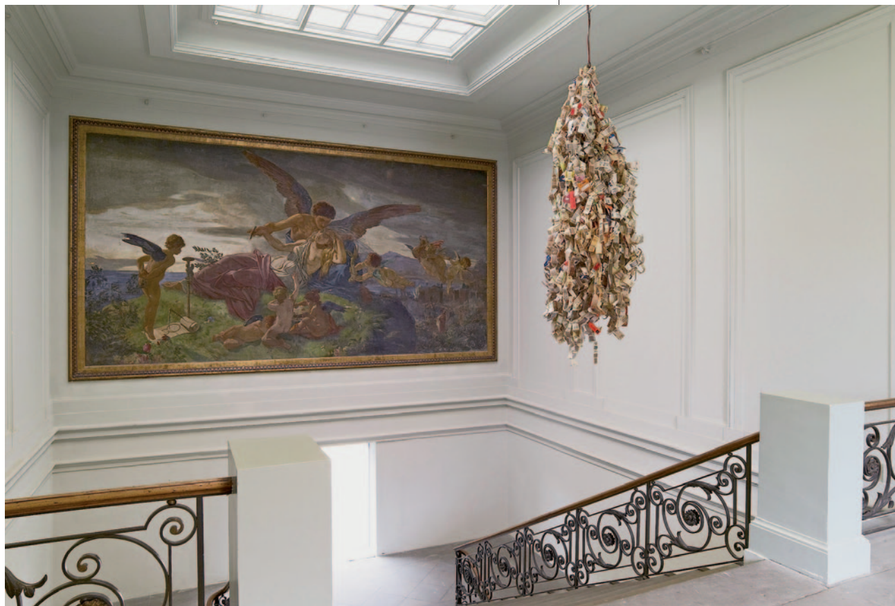
HARALD SZEEMANN Reiseskulptur, 1974–2005 magasság 250 cm, Ø=100 cm Archiv Harald Szeemann / Archive Harald Szeemann © fotó: Serge Hasenböhler © Kunsthalle Basel

ezek teljesítmények létrejöhetnek. A berni Kunsthallében – a kortárs művészeti centrumok között szokatlanul – olyan tematikus kiállítások sorozatát mutatta be, mint a Prähistorische Felsbilder der Sahara (1961), Puppen – Marionetten – Schattenspiel (1962), a Bildneri der Geisteskranken – Art Brut – Insania pingens (1963), az Ex Voto (1964) és a Science Fiction (1967), amelyek előzményei voltak későbbi „mérőföldkő”-kiállításainak: documenta 5 (1972), Monte Verita / Berg der Wahrheit (1978), Der Hang zum Gesamtkunstwerk: Europäische Utopien seit 1800 (1983) és a Geld und Wert – Das letzte Tabu (2002).