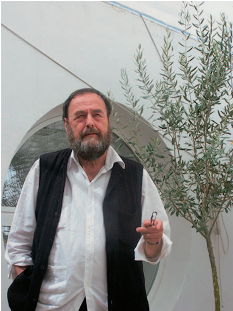
HARALD SZEEMANN, 2004

terjedt el, mint azok a tanulmányok, amelyeknek segítségével a kurátor szerepét megérthetjük vagy elemezhetjük volna. Ezt a jelenséget a szerző jobbára a kortárs művészeti kritika hibájának tartja, amely „figyelmét még mindig a művekre és azok hátterére fókuszálja, és hajlamos a kurátor tevékenységéről csak mint egy adott színházi modell megújítójáról beszélni”.