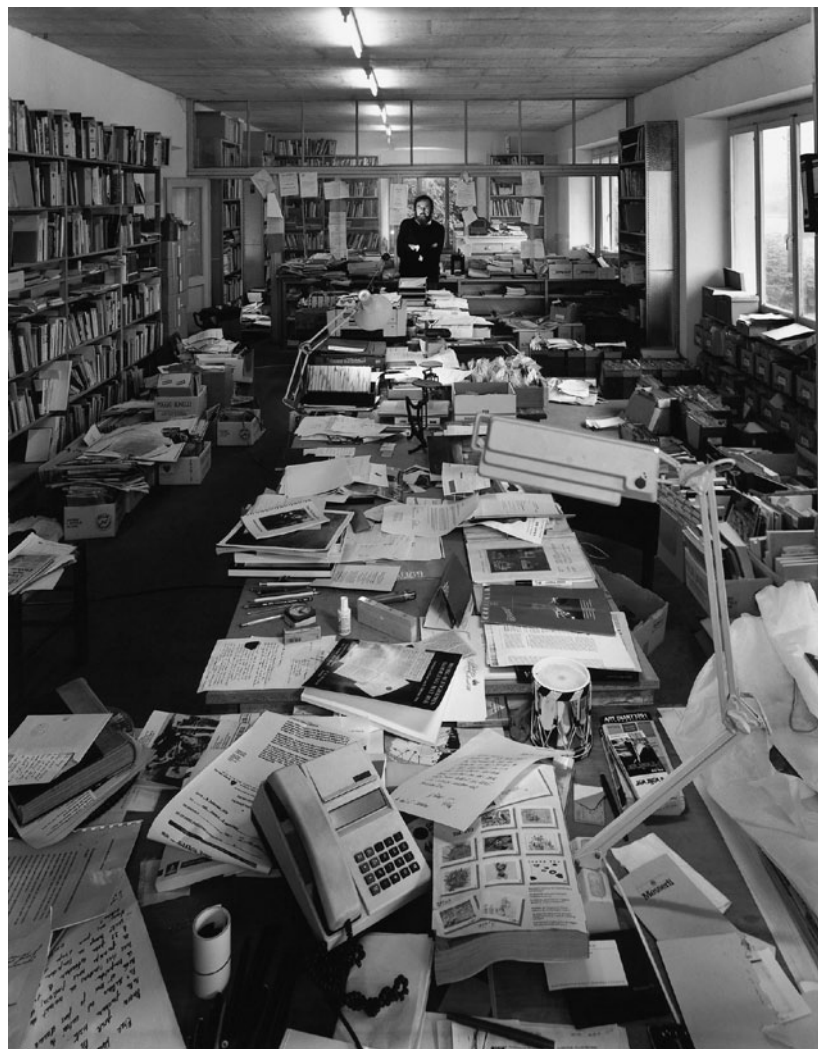
HARALD SZEEMANN Szellemi vendégmunka ügynökségében, 1994

„Ha az utolsó ember is meghal, aki az én kiállításaimat látta, akkor is ott lesz a Memoria, amely azután tovább lebeg még egy kicsit időben, mint valami individuális mítosz, de ha azután ez is véget ér, tulajdonképpen azt is jónak tartom” – mondta Harald Szeemann már egy kissé „nagyapás” rezignáltsággal, nem sokkal a halála előtt. 8 Amikor megkérdezték tőle (a kínaiak), hogy: „mi a te jövőd?”, azt felelte: „minél intenzívebben él az ember a jelenben, annál jobb a jövő – vagy?” 9 Ez a 'vagy' (ODER), amelyet olyan jellegzetes svájci hanghordozással ejtett ki, minden fontos mondata után ott rezgett még egy darabig a levegőben, mintha azt várta volna, hogy a vele beszélgető biztassa vagy helyeselje a gondolatait. Amikor a Velencei Biennálék kapcsán arról faggatták, hogy milyen képességekkel kell rendelkeznie egy művészettörténésznek ahhoz, hogy nemzetközi kiállításokat rendezzen, óva intett attól, hogy valaki „túlságosan is művészettörténész” legyen, vagy hogy a kapott szemrehányásokat tudományosan rendszerezze, mert „csak