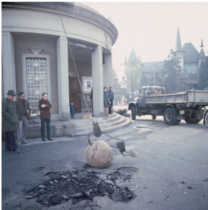
MICHAEL HEIZER Berni depresszió című szobrászati műve készítése közben, a When attitudes become form című kiállításra, a Kunsthalle Bern előtt, 1969. A nézők között Harald Szeemann (balról a második) és a művész.

autonóm kurátorét, amely azután megváltoztatta a kurátori tevékenységről alkotott addigi elképzeléseket. Az „Attitűd” kiállítás fogadtatása nem a szokásos művészettörténeti botrány volt, hiszen a közönség ezúttal nem a kiállított műveket vagy az egyes művészeket utasította el (azt is), hanem maga a kurátor került az általános viták középpontjába, és a kiállításról is kizárólag a kurátor személyén keresztül vitakoztak.