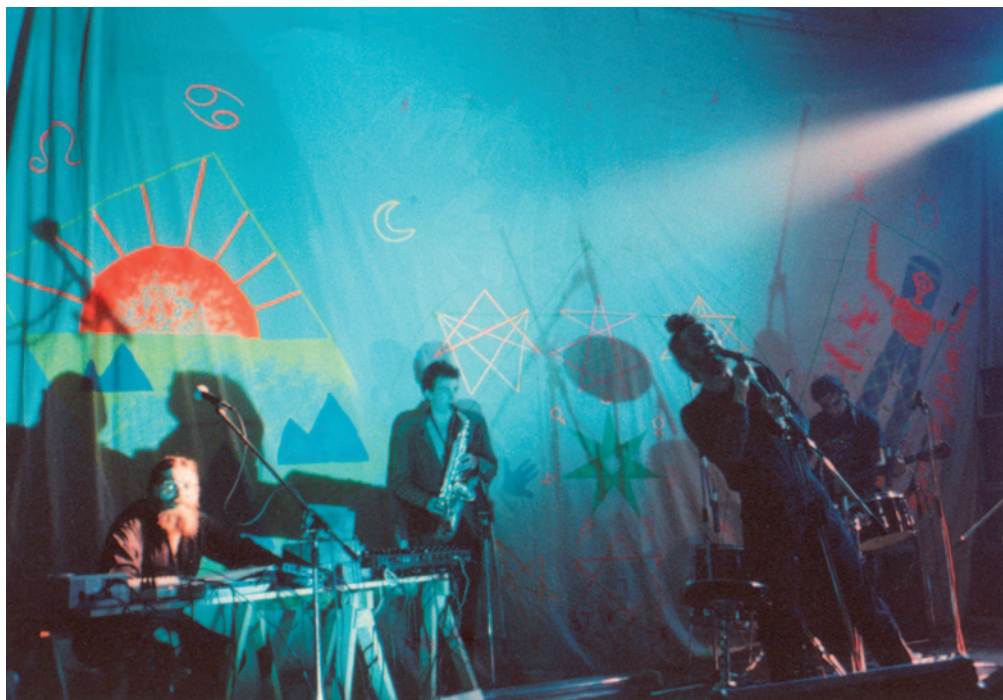
Still Europe. Konnektor-koncert, Amszterdam, Melkweg, 1988, © fotó: T. Balogh László

hogy „úgymond”, addigra ki kell kapni a visszhangot, majd azonnal vissza is adni, mert a király folytatja: „mennyit ér a velszi tartomány”.)