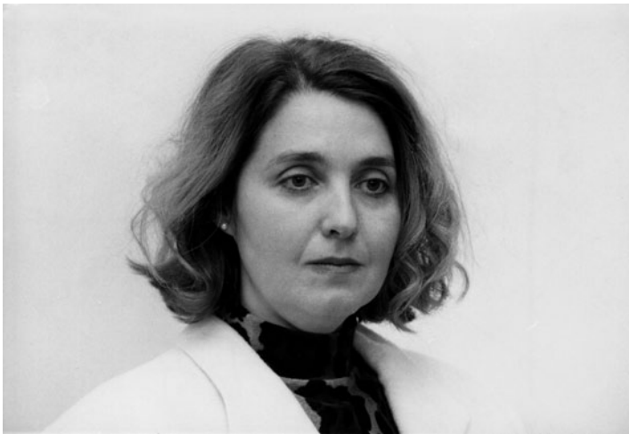
DÉLCEG KATALIN (1954–2010)