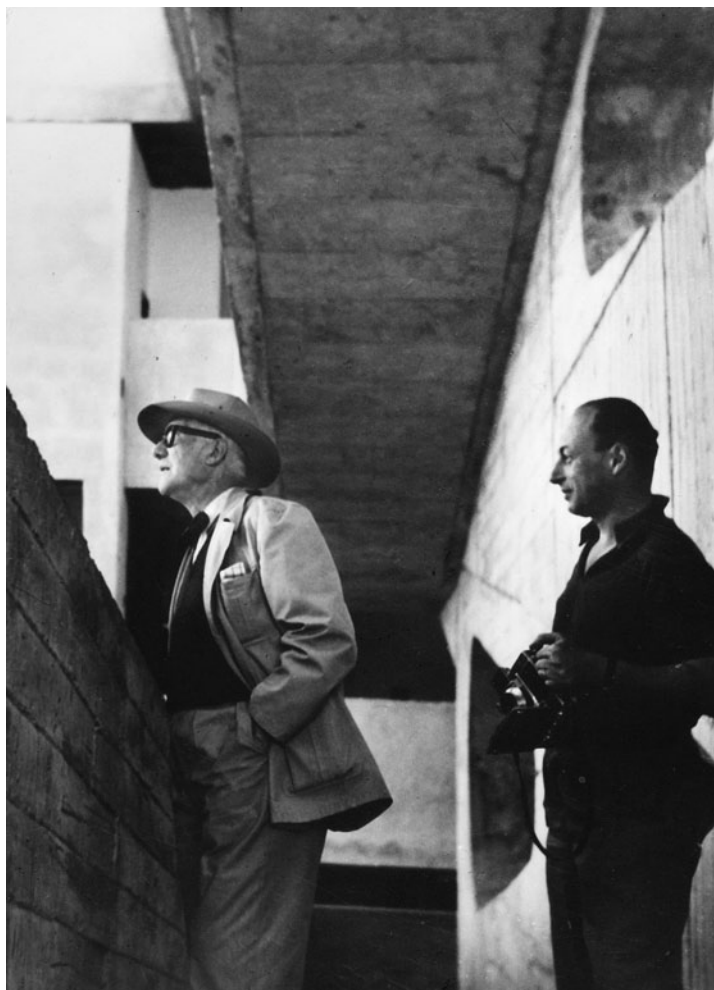
Le Corbusier és Lucien Hervé Csandigarban a Legfelsőbb Bíróság épületében, India, 1955

zésében alkottak maradandót, hanem a humanitásra neveléssel, a harmonikus, kiegyensúlyozott „új életre” való felkészítéssel új célokat is megfogalmaztak. Az új festészethez kapcsolódó, radikálisan modern építészeti vezető teoretikusa Le Corbusier lett, aki az építésznek komoly társadalmi és bizonyos mértékben kulturális szerepet szánt.