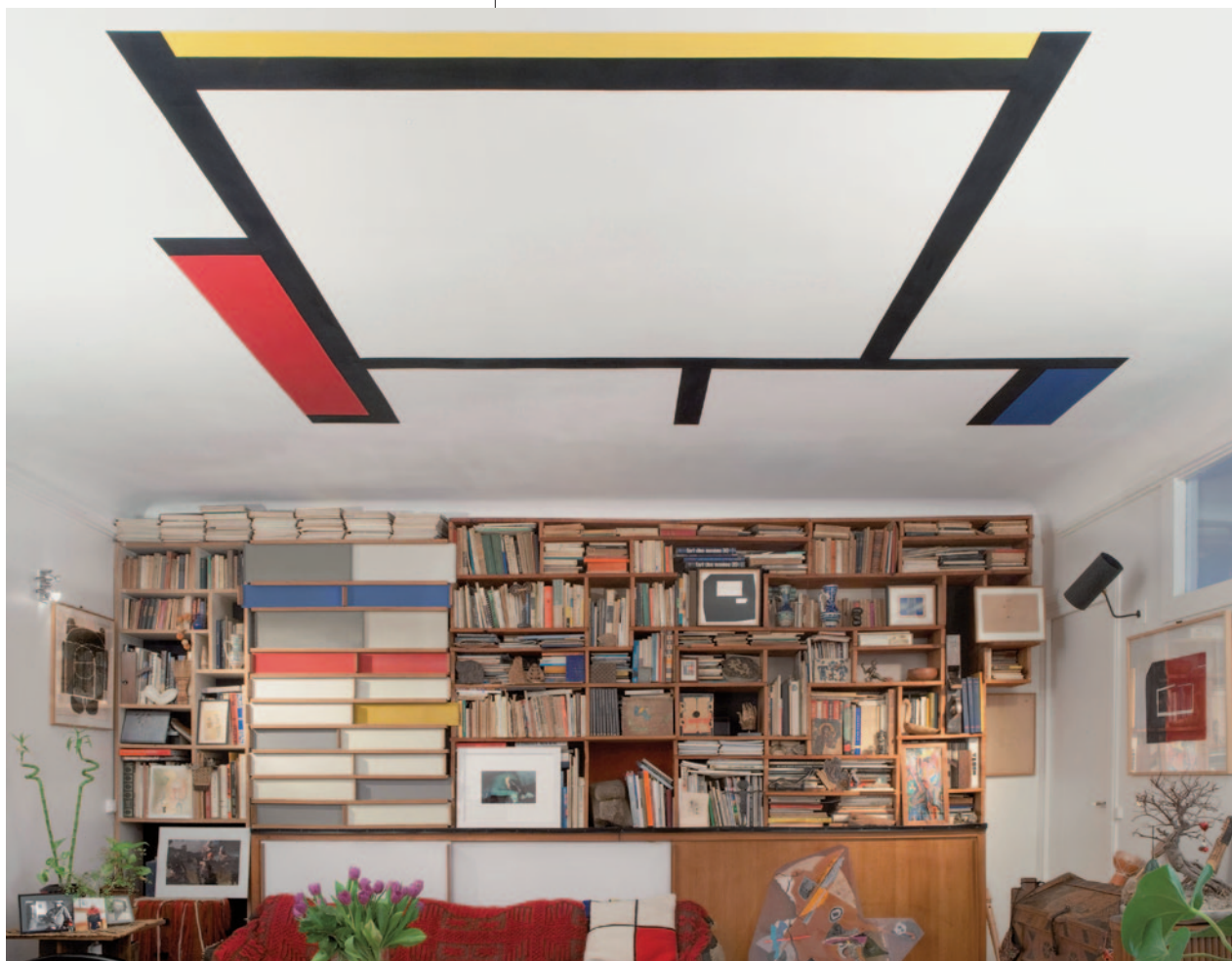
Lucien Hervé lakása, Párizs, 2009, © fotó: Cseh Gabriella