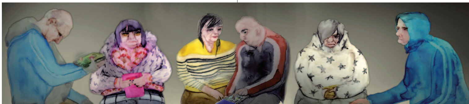
SZABÓ ESZTER Öregek otthona 2039, 2009, videolooop hanggal, 2:17