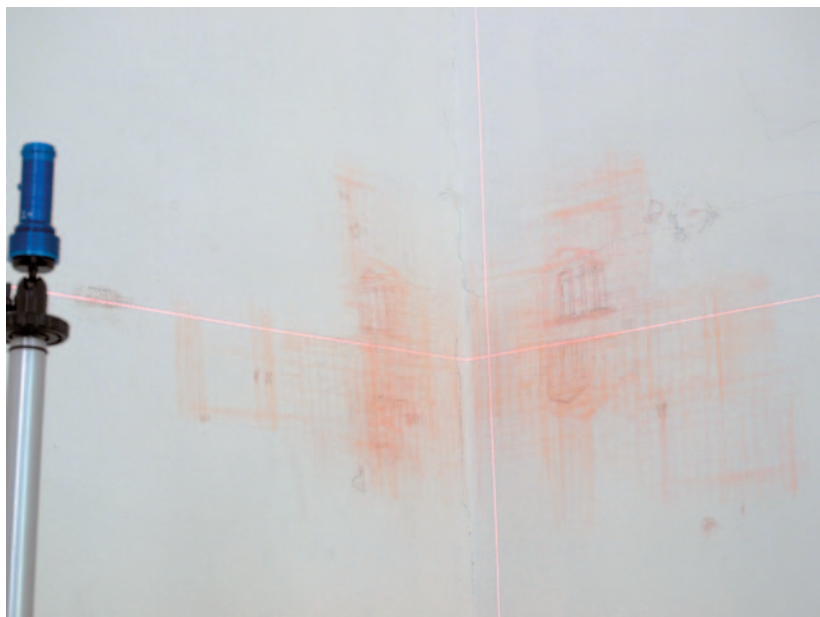
TIBOR ZSOLT É-D-K-Ny / Kunszenthalla, 2010, falrajz, lézeres szintező