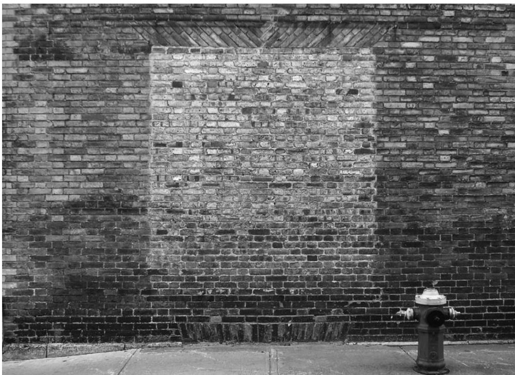
JOHN CORNU Wash art, 2009, Washed architectural element Québec (Canada) © John Cornu; Courtesy the artist