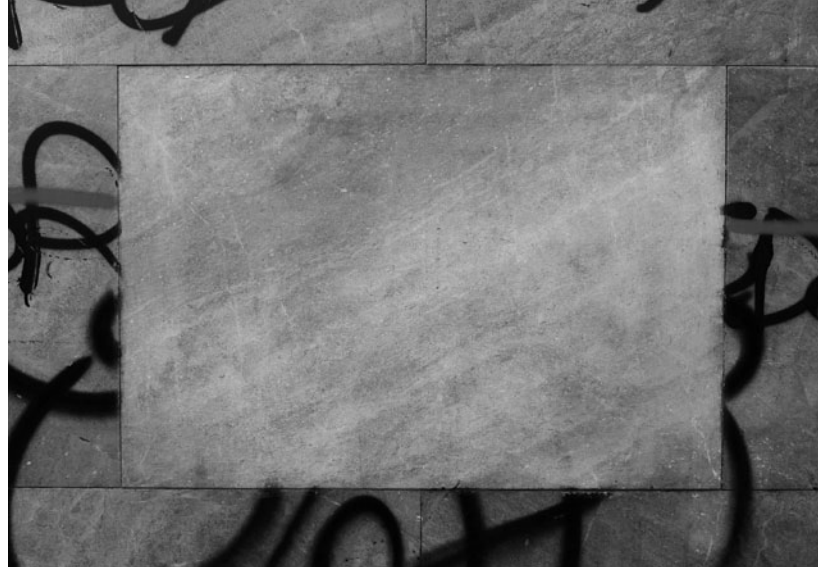
John Cornu Wash art, 2010, Washed architectural element, Barcelona © John Cornu; Courtesy the artist