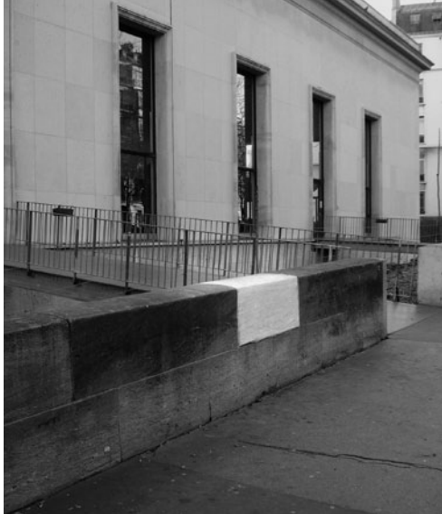
JOHN CORNU Wash art, 2008, Washed architectural element, Palais de Tokyo, Párizs