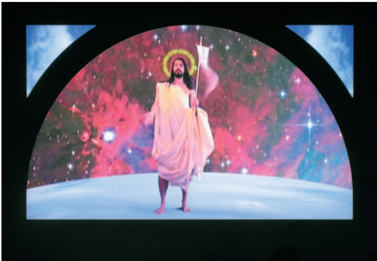
MÁTRAI ÉRIK Galaktikus feltámadás, 2008, videó