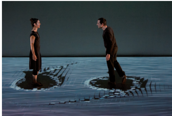
COMPAGNIE ADRIEN M Cinématique, Trafó Kortárs Művészetek Háza, 2011, © fotók: Zelkó Csilla

A magam részéről a különféle szenzorokkal, kamerákkal és szoftverekkel való operálásnál sokkal érdekesebbnek, finomabbnak találtam az előadás elején folyó játékot, ahol a színpadra vetített képet a két előadó konstruálja egy kis asztalkán, kamera alatt. Így például, míg egyikük kis kavicsokat rakogat egymás mellé, addig társa már a felnagyított sziklákon lépeget a semmi felett, a másik isteni kénye-kedvének kiszolgáltatója. A probléma végső soron nem a képek túlzott jelenléte – ezek transzparenciájukkal, illékonyágukkal nem nyomják agyon az előadást –, hanem az, hogy a produkció ki is merül a látványban. Időnként villan csak fel egy-egy percre „valami”, amikor pl. betűk állnak össze hatalmas, virtuális testté Satchie körül, mint egy organikus burok, amely a lánnyal három dimenzióban mozog együtt. Túlzottan elgondolkoztatni ez az előadás nem fog, csak elbűvölni, holott – ahogy föl-