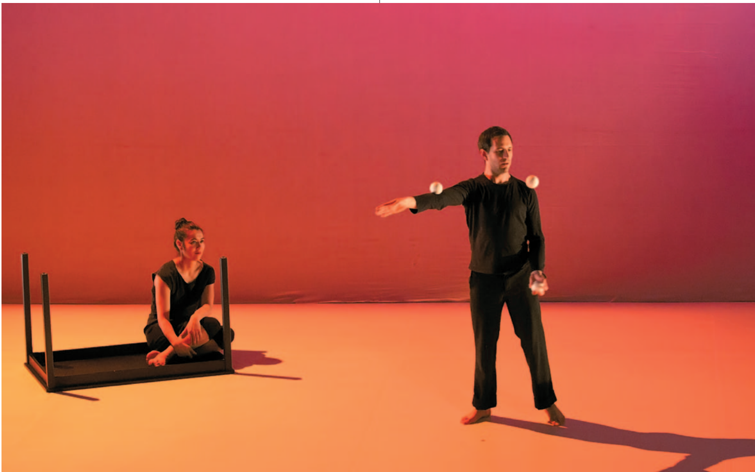
COMPAGNIE ADRIEN M Cinématique, Trafó Kortárs Művészetek Háza, 2011, © fotó: Zelkó Csilla

Az egyetlen, ami továbbgondolásra érdemes a közhelyeken túl – emberi test kontra mátrix-világ stb. – az a labdákkal, üveggolyóval való zsonglörködés virtuálissá tétele. Pontosabban: Mondot oly módon képes bánni rekvizitjeivel, hogy azok sima, könnyed, akadálytalan mozgása a monitoron vagy épp a színpadon futó/eső karaktereket juttatja eszünkbe. Mondot rájátszik erre az illuzórikus akadálytalanságra, ahol megszűnnek a fizikai törvények. Voltaképp az artista-munka abszolútumát valósítja meg (uralni, legyőzni a természet törvényeit), ám furcsamód – és talán épp ezért – a hiba, rontás itt „illetlen” lenne, míg a hagyományos cirkuszban megengedhető. Sajnos azonban ez a motívum nem kapott nagyobb hangsúlyt a darab során, így az (akárcsak a DV8 hasonló előadása, a Just for Show ) megreked a „szép” kategóriájában.