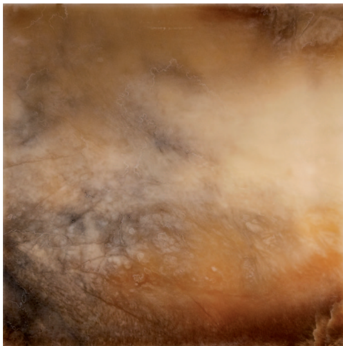
TACITA DEAN Three Pairs, 2009, sorozat, 6 rajz, 'Agatha' alabástrom kő, 60 x 60 cm