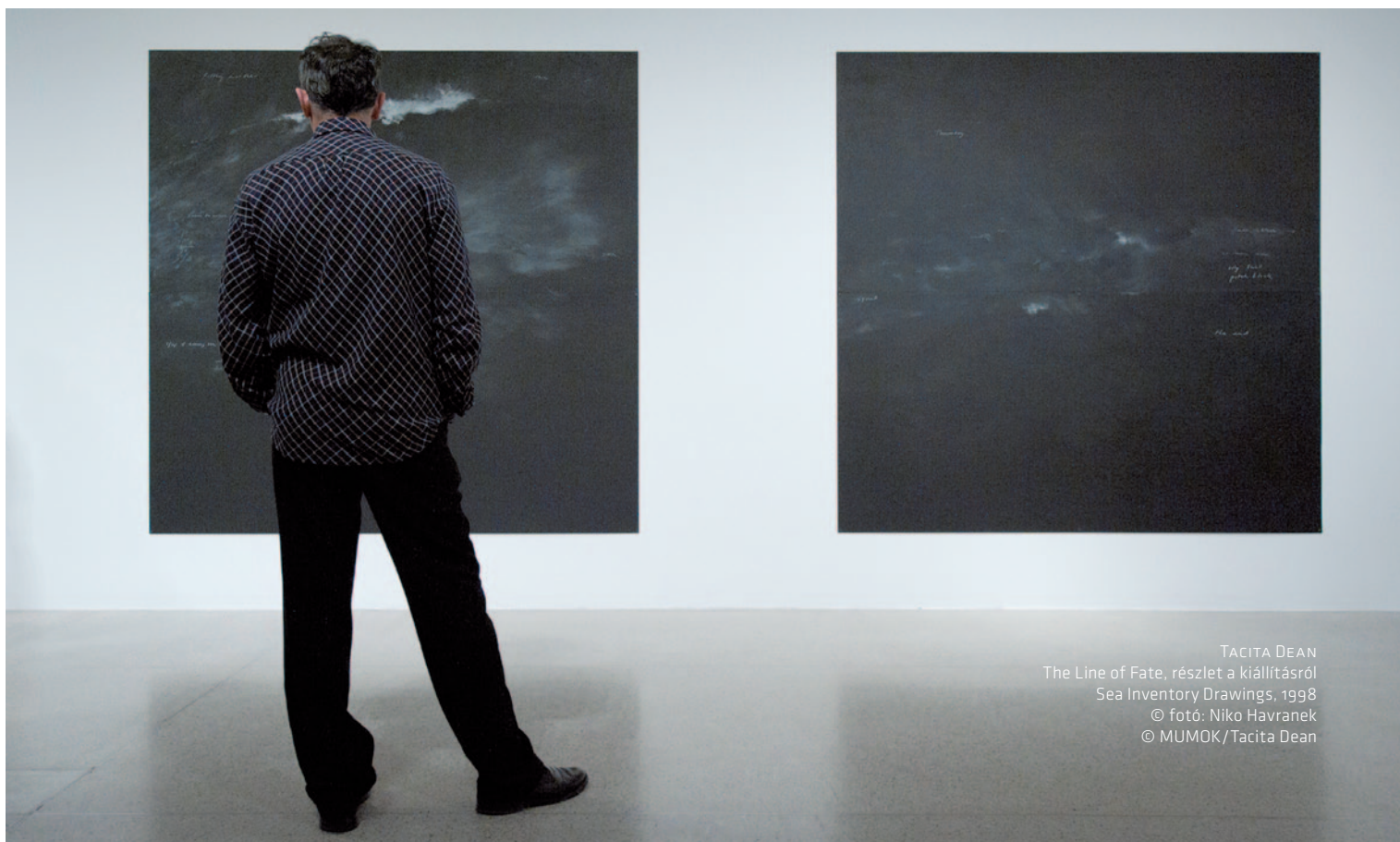
TACITA DEAN The Line of Fate, részlet a kiállításról Sea Inventory Drawings, 1998 © fotó: Niko Havranek © MUMOK/Tacita Dean

ványaiból. Nem áztatja magát (vagy a nézőt) azzal, hogy létezne egy mindenki által megismerhető narratíva. A meglévő felhasználásával kereteket kíván adni, általuk pedig biztosítani azt, hogy kiemeli ezeket a „történeteket” a kollektív felejtés közegéből. Ez az állapot azonban a digitális technikák steril működésének következtében megszűnik. Az utóbbi évek filmes munkáinak hátterében éppen az ebből fakadó felismerés és az abból táplálkozó aggodalom húzódik. Ezzel a vesz- teséggel igyekszik szembeszállni azoknak a filmes munkáknak a segítségével, amelyeket 2001 óta készített ( Fernsehturm 2001, Cranway Event 2009 stb.). Ezek a művek önmagukban is fontos alkotások, de itt a sorsvonal kontextusában újabb jelentésréteg rakódik rájuk.