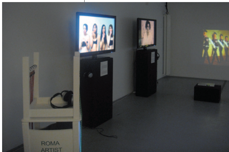
Új média a kezünkben / Roma új média-művészek Közép-Európában. Menü Pont – Műcsarnok, Budapest, 2011. április 9 – 30., (részletek a kiállításról)