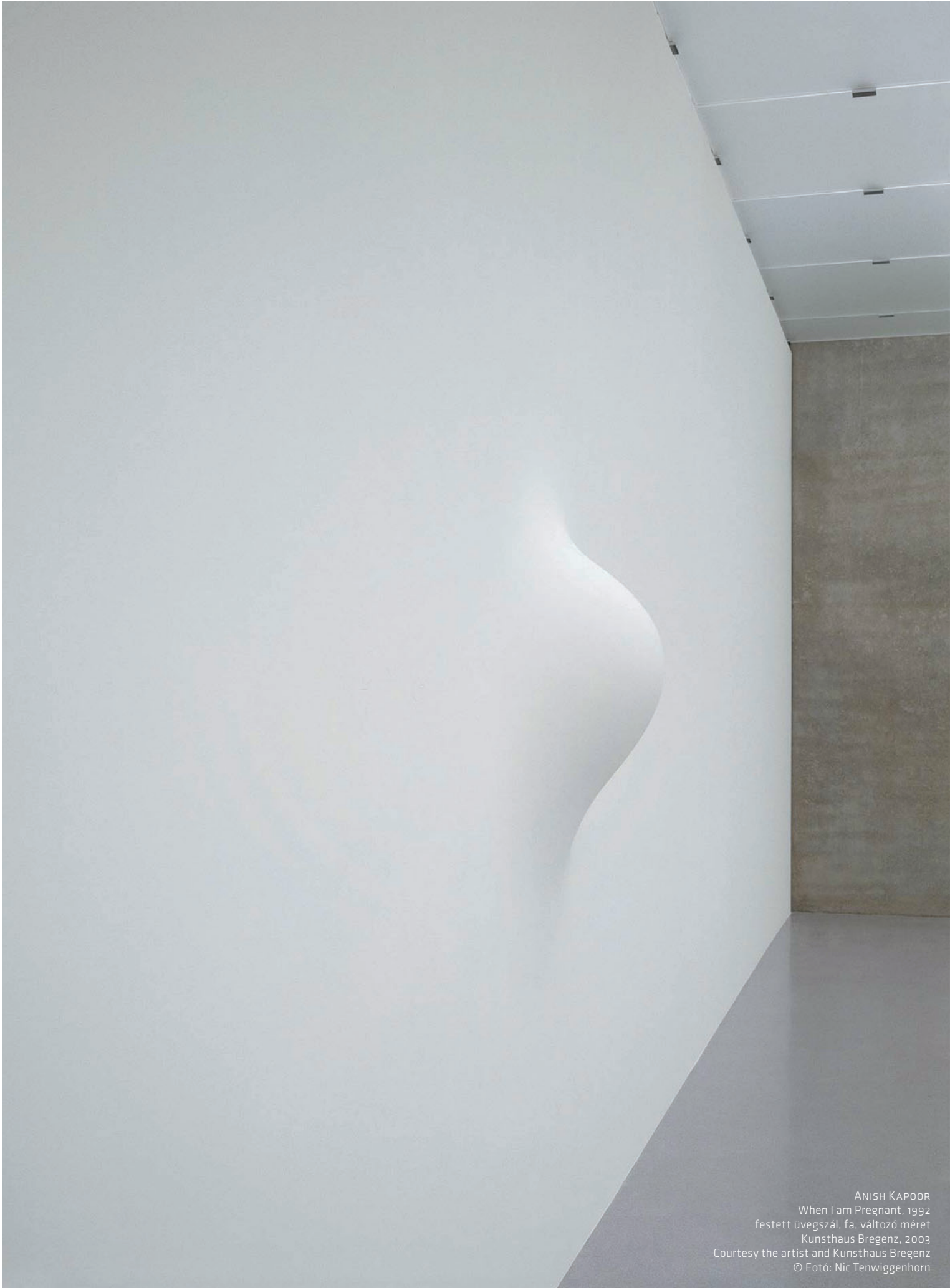
ANISH KAPOOR When I am Pregnant, 1992 festett üvegszál, fa, változó méret Kunsthau Bregenz, 2003 Courtesy the artist and Kunsthau Bregenz © Fotó: Nic Tenwiggenhorn