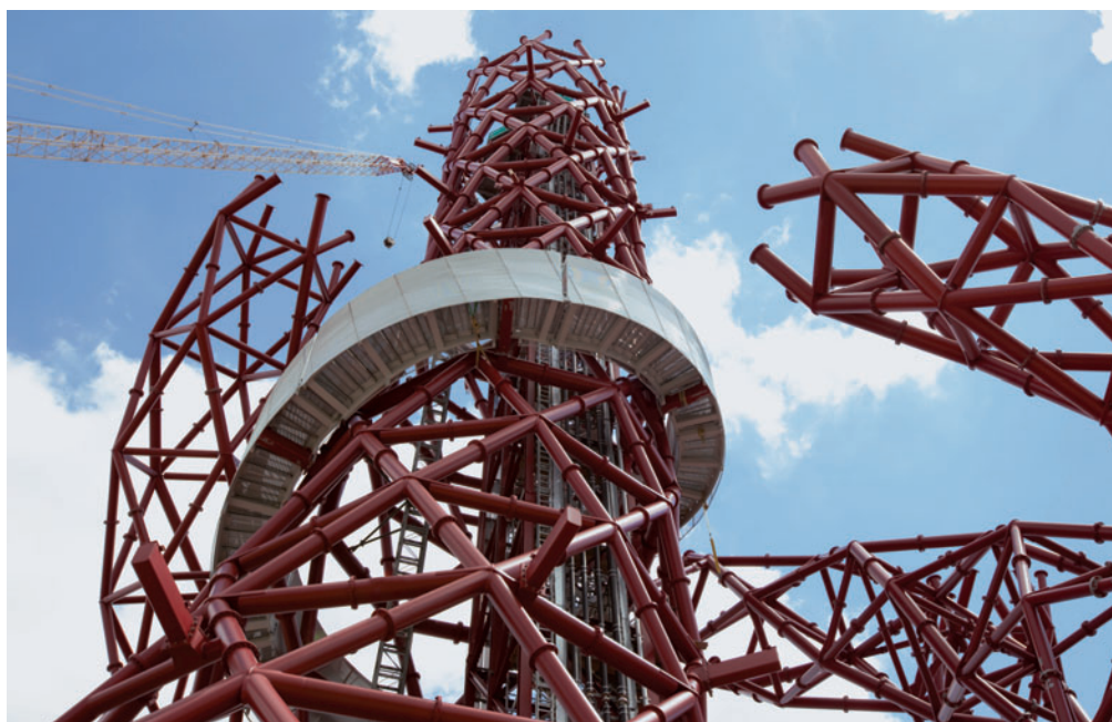
Az ArcelorMittal Orbit építés közben, 2011. július 1. © Fotó: Stephen Hird © ArcelorMittal