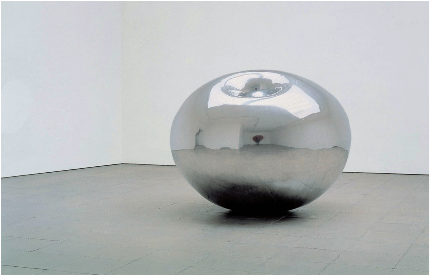
ANISH KAPOOR Turning The World Inside Out, 1995, rozsdamentes acél, 148 × 184 × 188 cm Bradford Art Galleries and Museums. Acquired in 1997 with a contribution from the Art Fund and with support from the National Lottery through the Arts Council of England, the NACF and The Henry Moore Foundation, © Anish Kapoor 2011