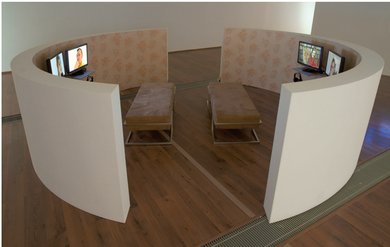
KORONCZI ENDRE Kikenyszerített vallomás, 2008, 4 csatornás videoinstalláció, MODEM, 2011, kiállításenterőr