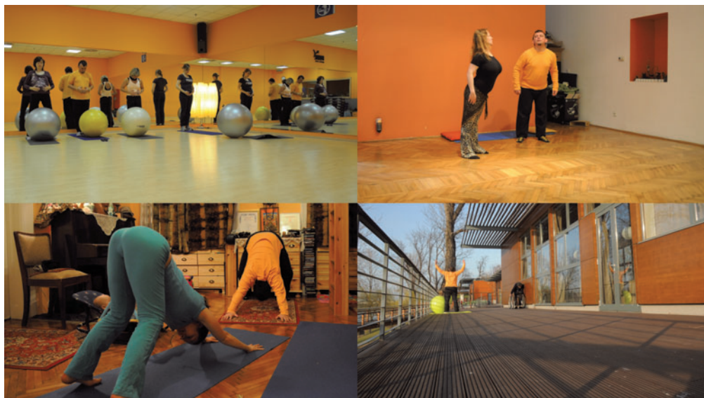
KORONCZI ENDRE Másállapot, 2011, 4 csatornás videoinstalláció

Koronczi rögzíti a történeteket, a régebbi munkák rekonstrukciói mellett nagyrészt videókat, emellett néhány fényképet és printet mutat be. Tudatosan vágják bennünk. Az intim szféránkba történő behatolást azért nem érezzük kellemetlennek, mert mindig önvallatással kezdi a bűvárkodást, megmutatva legbelsőbb vívódásait. Beavtja az érdeklődőket élettörténet-értelmezéseibe. Felszínre kerülnek magánéleti problémái, elváltként elemzi gyermekéhez, apaságához (Vénusz, 2005), hajdani házastársához, közös élettereikhez, barátaikhoz (Basic projekt, 2003-2004) való viszonyát. Ugyan férfiszemmel ábrázolja a világot, de próbálja magát női szerepekben is elképzelni. Habár a férfiemóciók kimutatása egyre elfogadottabb, ennyire mély, őszinte elemzéssel, számvetéssel ritkán találkozhatunk. Ráadásul az érzékeny művész még a képzelet birodalmába is elkalauzol bennünket, kibővíti a kiállítás, a lehetőségek terét. A terem falára „vetített” Lilly a fal túloldalán a szerelemről beszél... (2011) mondat átvezeti a nézőket a nemlétező valóság világába, ahol bármi megtörténhet. Ahhoz azonban, hogy valóban megtörténjen, át kell jutni a fal túloldalára, leküzdeni a kiszolgáltatottság-érzetet, bizalommal fordulni a világ felé, merni bárhol álomra hajtani a fejünket, kiszolgáltatottságunk tudatában (ExtrémAlvás, 2006–2007). Koronczi segít eljutni a fal túloldalára, annak ellenére, hogy a Nehezen feltehető kérdések valóban nehezen feltehetőek és annál nehezebben megválaszolhatóak.