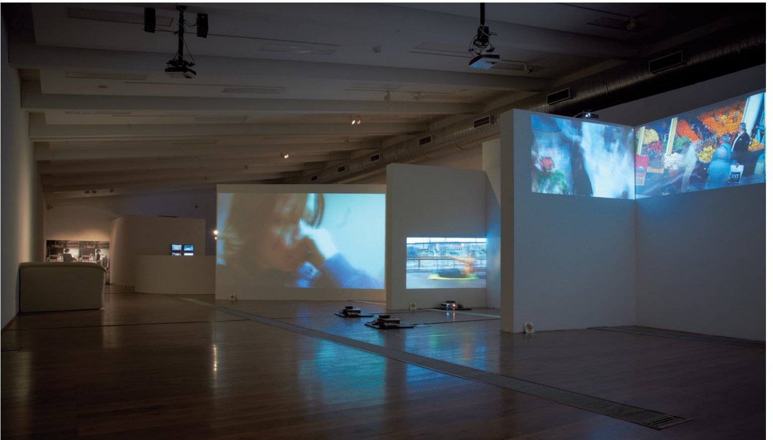
KORONCZI ÉNDRE Hard to ask..., MODEM, 2011, kiállításenterőr