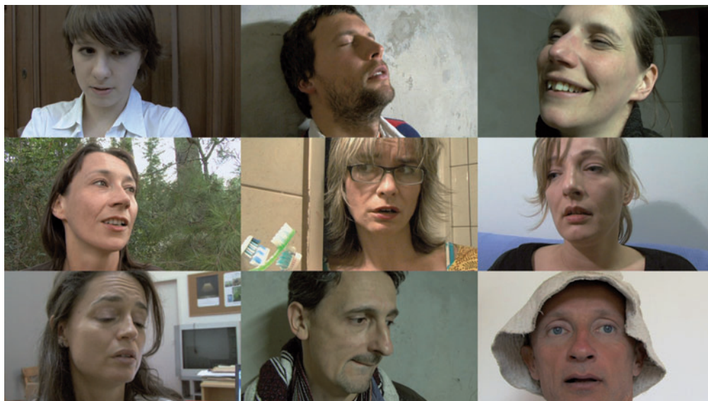
KORONCZI ENDRE Sóhajtozás-gyűjtemény, 2011, videoinstalláció