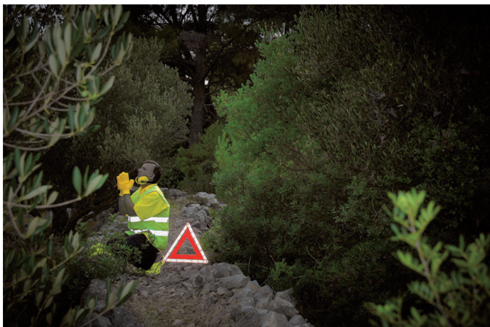
KORONCZI ENDRE Hard to ask..., 2011, werkfotó