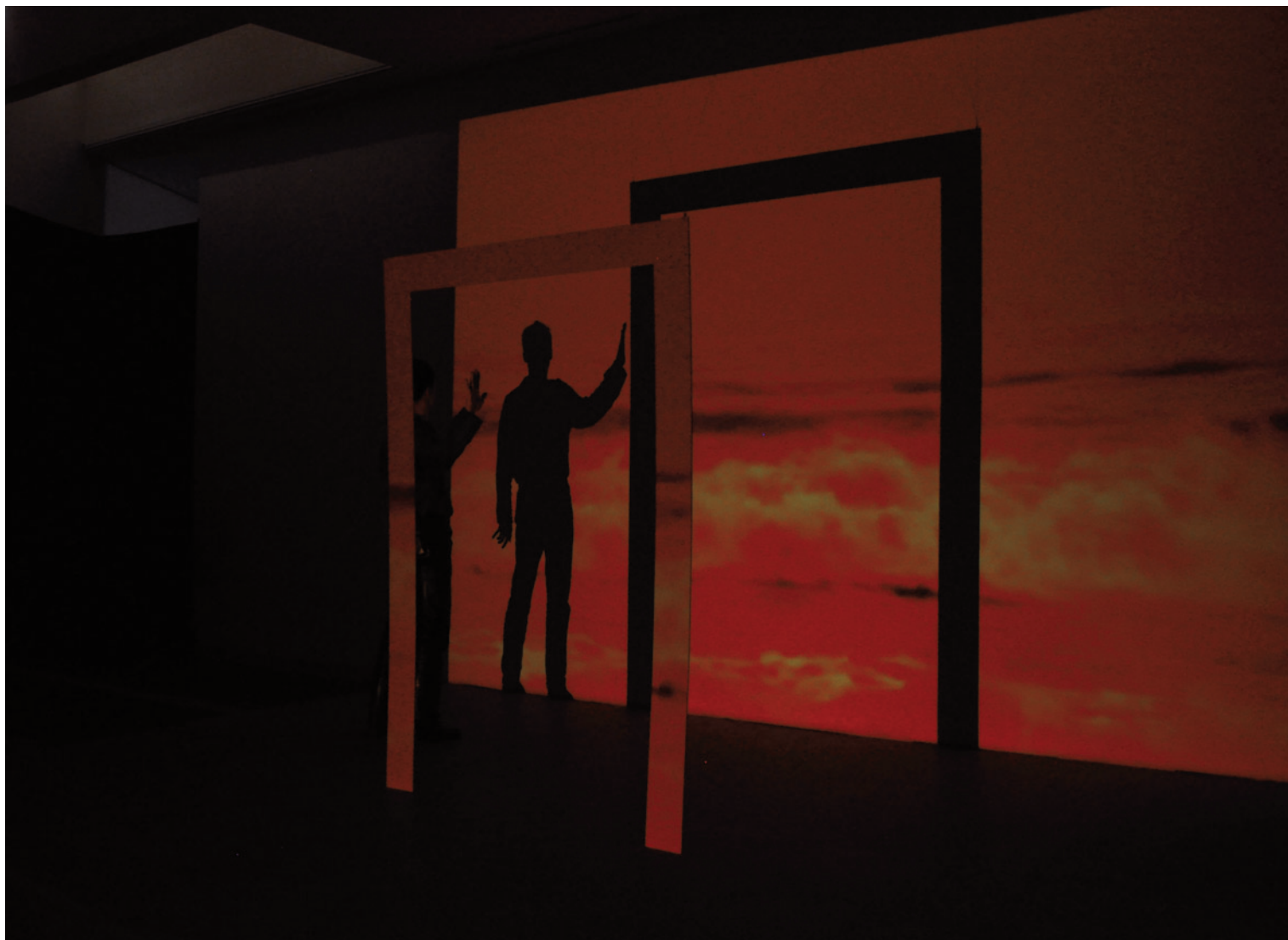
MÁTRAI ERIK Tenger kapu, 2011, installáció, Kortárs Művészeti Intézet, Dunaújváros

a médiumhasználat mikéntje jelenti, s még ebben is találunk számos egyezést (pl. festészeti iskolák esetében), így hozzáadódik a médiumhasználat mikéntjéhez az a kontextus, amelyet elsősorban a mű alkotójának többi műve és az azokat övező szellemi háttér teremt meg. Visszatérve a konkrétumokhoz: Penone kompozícióihoz mint anyagot használja a tövist, melynek kulturális referenciái hozzáadódnak e művekhez, de nem kölcsönöznek számukra semmilyen narratív tartalmat. Mátrai figuratív tövisműveinek a narratív tartalom képezi az alapját, ehhez pedig olyan médiumot használ, mely a narratív tartalom aláhúzására, s a kifejezés expresszivitásának fokozására szolgál.