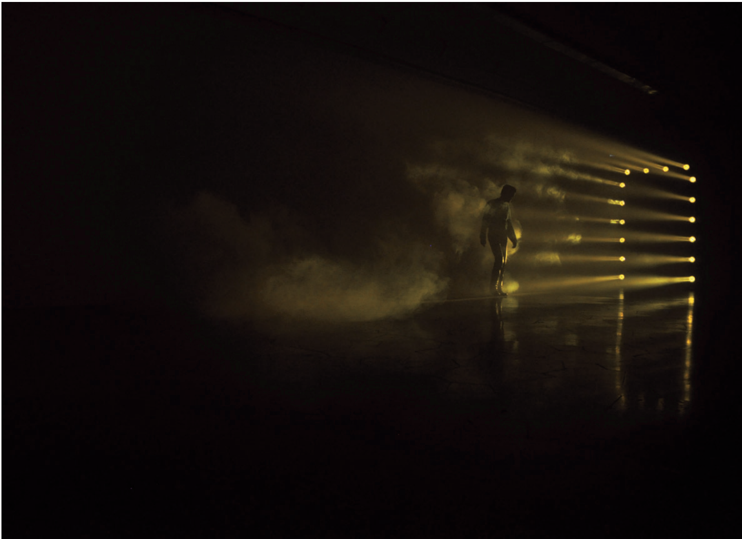
MÁTRAI ERIK Szpot kapu, 2011, installáció, Kortárs Művészeti Intézet, Dunaújváros

élő brit művész fényinstallációit szokás filminstallációknak is nevezni, mivel azok filmes technikán alapulnak: filmvetítő-géppel olyan animációkat vetít a falra vagy a földre, amelyekben fekete alapon fehér pont(ok), kör(ök), görbülő vonal(ak) vannak mozgásban vagy transzformálódnak egymásba. Az elsőtétített kiállítótérben a vonalakat kivetítő fénypásmák térbeli struktúrákat hoznak létre. A filmvetítő (vagy az újabb munkákban a projektor) nagyítólencséjének köszönhetően a vetítetűfelület felé táguló fénysugarakból kinetikus fényszobrok jönnek létre, melyek előre megtervezett mozgásába esetleges befolyásolóelemként a fénycsóva útjába álló közönség is szerephez jut. Kezdetben McCall nem is használt füstgépet, mivel az első néhány évben műveinek bemutatására olyan off-space helyeken került sor – New York-i raktárépületekben és mozikban –, ahol a levegő apró porszemcséi megfelelő körülményeket biztosítottak a fénycsóvák térbeli láthatóvá tétele számára 10 . McCall tölcészerű fényképződményeket a térbe rajzoló filminstallációinak fókuszában a fény anyagi mivoltának és térszervező hatásának tanulmányozása áll, művészeti gyökereik pedig a hatvanas-hetvenes évek fordulójának