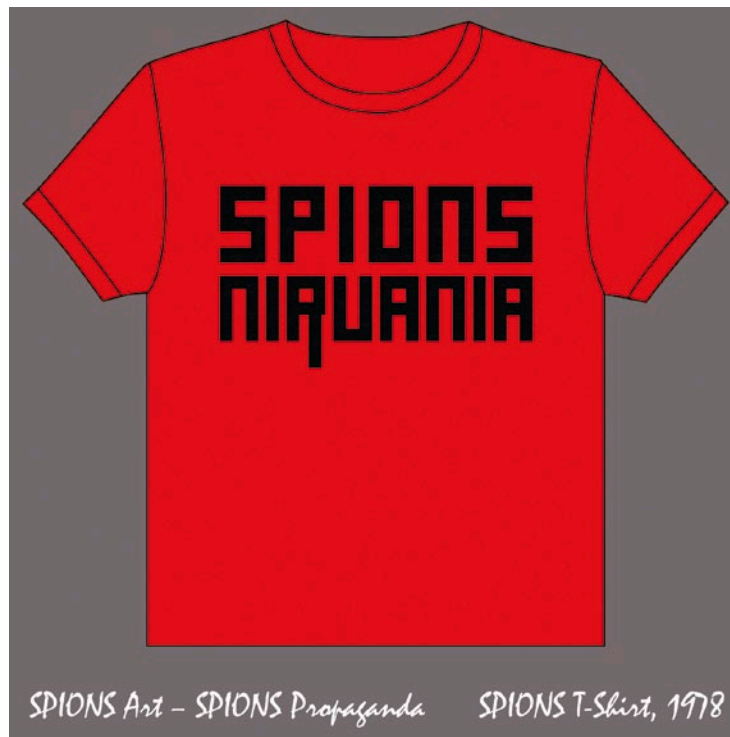
SPIONS NIRVANIA póló terve, 1978