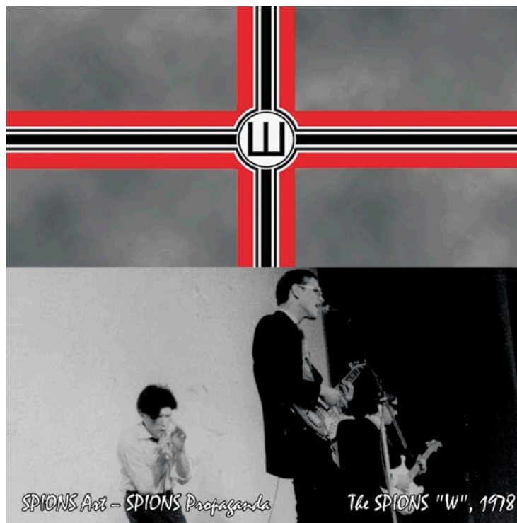
SPIONS W-logó terv