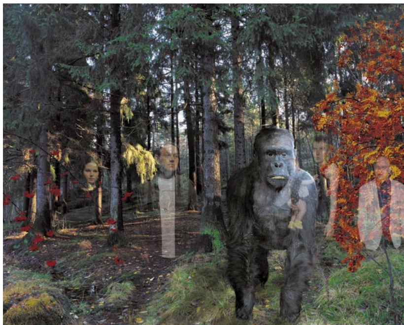
OLEG KULIK Windows – Gorilla, 2000–2001, C-print, 90 × 112 cm