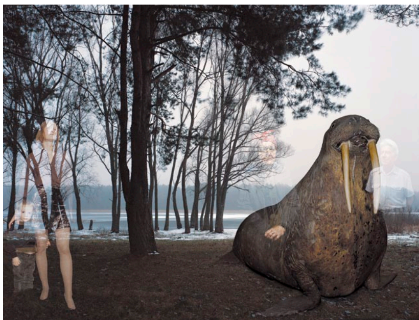
OLEG KULIK Windows – Walrus, 2000–2001, C-print, 90 × 118 cm

közönyéhez kerül közel, mintsem a tájképhez magához. Mindez már az avantgárd bevezetője, ahol a tájkép a mentális tájhoz, a fényáradathoz és a különféle hallucinációkhoz nyit utat.