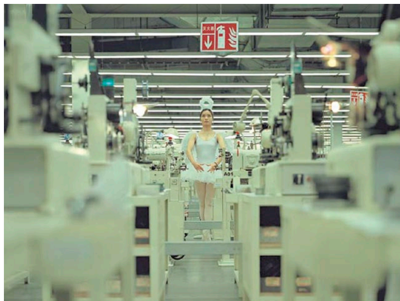
CAO FEI Whose Utopia, 2006

sélni annak az ötszáz önkéntesnek a munkáját, amelynek eredménye az összefogásba vetett hit által implikált csodás eredmény: egy hegy elmozdítása. Vajon érthetőek volnának-e az elmesélendő történetek a vetített kép kizárólagos jelenléte és annak installálási módja által, vagy a mozgókép nem állna meg a saját lábán? Rákényszerülnek-e a vetített képek, hogy szüntelenül támaszként használják velük kapcsolatban a művek mellett elhelyezett információs szövegeket? Egy átlagos mozifilmnél ez nincs így, bár utánanézhethünk a film történetének, még mielőtt a moziba elmennénk. Mindenesetre egy mozifilm története bármilyen leírás nélkül összeáll a néző fejében, de legalábbis össze kell, hogy álljon a vetítés másfél órája alatt. Viszont pont ezzel a problémával küzd minden olyan kiállítótérbe helyezett mozgókép, amely valamilyen történetet kíván a nézőinek felkínálni. Ám akárhogy is igyekeznek, egy mozgóképes installáció csak kivételes esetben képes történetet mesélni mankók nélkül. Azt, hogy ehhez a konklúzióhoz a Once Upon a Time című kiállításon látható válogatás is elvezet minket, erősen kétlem. Ettől függetlenül mégis az idei nyár egyik fontos, kizárólag mozgóképeknek szentelt kiállításáról van szó, ahol a felvonultatott munkák önmagukban és egybegyűjtve is izgalmas interpretációkra kínálnak lehetőséget, és ez már önmagában is elég, hogy ne (csak) elégedetlenkedjünk.