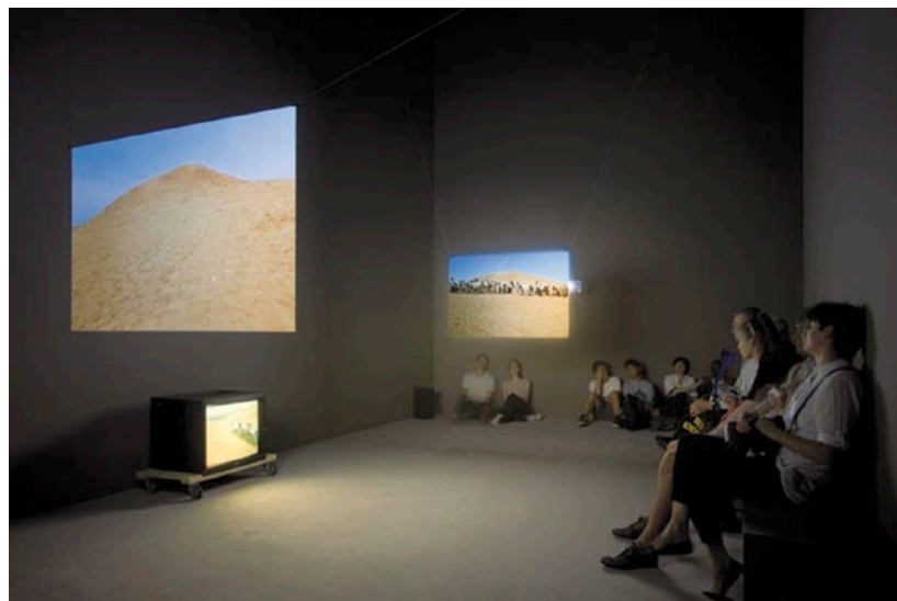
FRANCIS ALYS When faith moves mountains, April 11, 2002 © 2011 Francis Alÿs. Courtesy Galerie Peter Kilchmann, Zürich