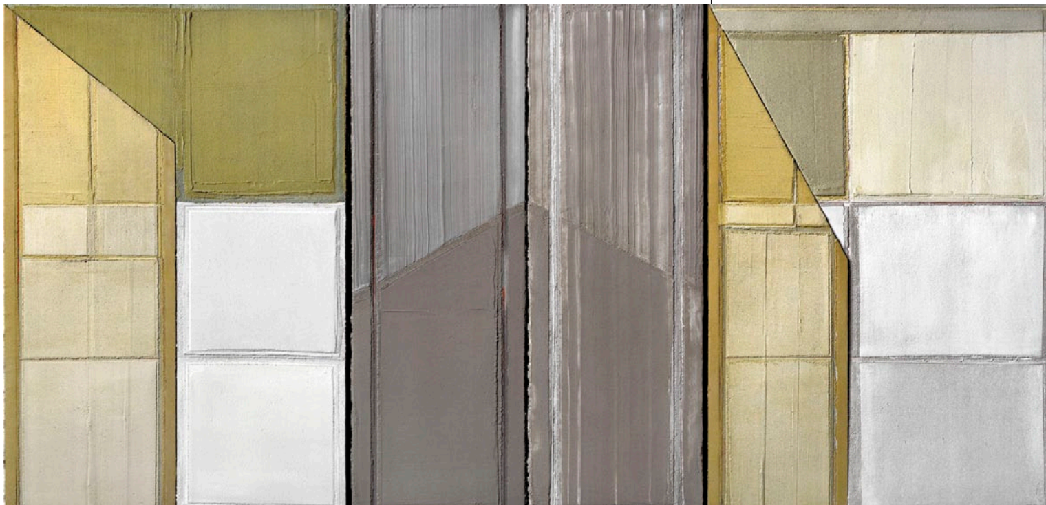
DRÉHER JÁNOS Ablakok-élek, 2008, vegyes technika, 150 × 300 cm