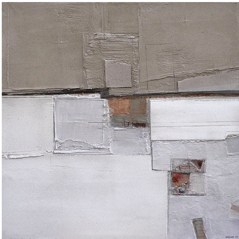
DRÉHER JÁNOS Törédék rajz, 2007, vegyes technika, 100 x 100 cm