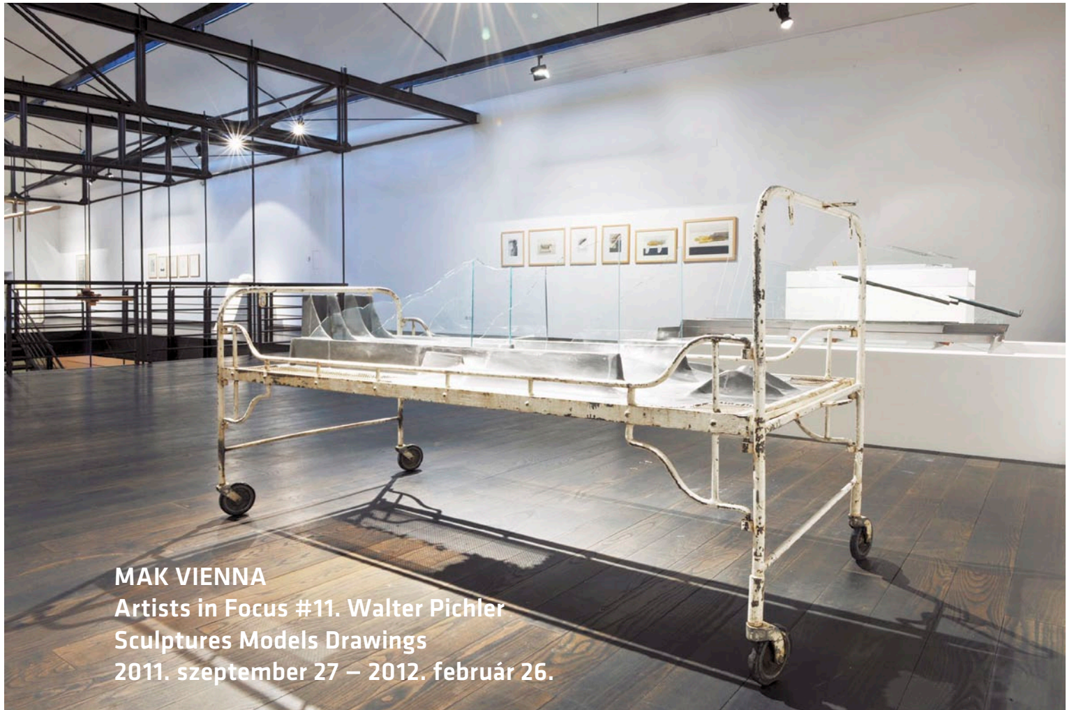
MAK VIENNA Artists in Focus #11. Walter Pichler Sculptures Models Drawings 2011. szeptember 27 – 2012. február 26.