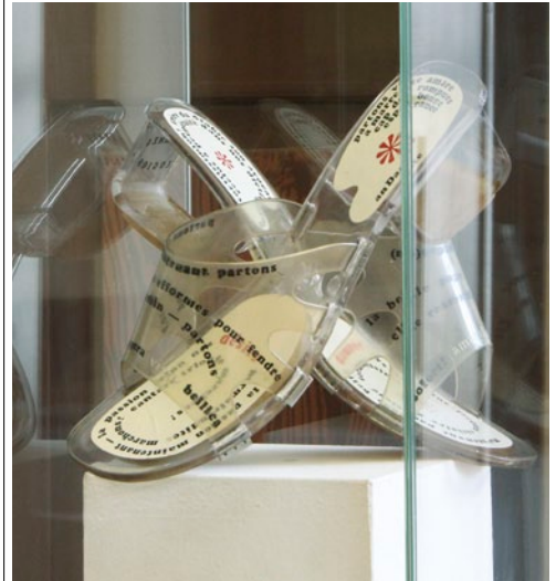
NAGY PÁL Amaryllis, 1981, © Fotó: Rosta József

NAGY PÁL Metropolisz , 1976, (részlet), ólomkompozíció, © Fotó: Rosta József