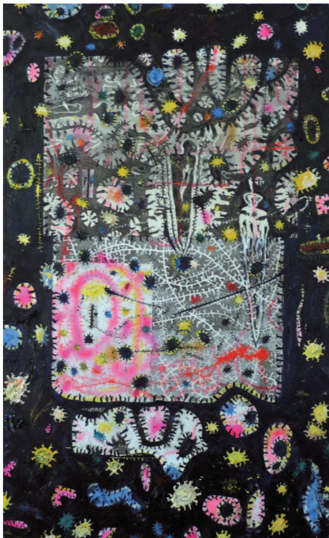
GUNTER DAMISCH DUNKLES LEUCHTROTWELTCOLLAGENFELD, 2011–12, olaj, vászon, 180 × 110 cm

denciáihoz (így például mesteréhez, Arnulf Rainerhez) is köthető „metamorf” alakzatainak szemantikai nyitottságát. 5 Gesztenyeszerű burokrendszerei papucsállatkáknak, bogaraknak, esetleg stilizált napjeleknek, csillagoknak is tűnhetnek – kompozíciói egyszerre idézik a mikroszkóppal szemlélt enyészetet és a csillagászati távcsővel vizsgált univerzumot. A gesztenyeszerű formákat Damisch világoknak nevezi; parányi, nyüzsgő figurákkal benépesített, izolált bolygórendszereknek tűnnek, melyek a leibnizi monászokat idézik. „Az anyag minden egyes részét tekinthetjük dús növényzetű kertnek és halakkal teli tónak. De a növény mindegyik ága, az állat mindegyik tagja, nedveinek mindegyik cseppje ismét ilyen kert és ilyen tó” 6 – idézhetjük a német filozófus Monadológiájának költői