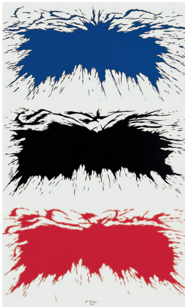
HENCZE TAMÁS Színtörés, 2009, olaj, vászon, 120 × 60

tömörségű leírását, mely képszerű megfogalmazását adja annak a megállapításnak, miszerint „a természetben minden telítve van”. 7 Ennek a horror vacuihoz hasonló telítettségnek igézetében alkotta meg Damisch expresszív, Klee-vel összevethető kert-vízióit, centrum nélküli „all over”-jeit, 8 melyek elemei, mintha valamiféle folyton alakuló plazmában, a mindenség őszanyagában, a képek képlékeny szövetében úsznának, melyet a fiatalon elhunyt magyar esszéistát, Popper Leót idézve Allteignak is nevezhetünk. 9