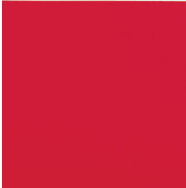
HENCZE TAMÁS Négyzet felett, 2009, olaj, vászon, 120 x 80 cm

koncentrált, mégis játékosan felmutatott energia-konzervek. Meditatív, mégis immanens mozdulat-ikonok, tartózkodóan monokróm, tükörsima héjstruktúrák, jelentésküldő, ürességük ellenére is telített jelek. A paradox módon „nem kézzel festett”, mégis manuális-jellegű ecsetmozgás (valójában annak másolata) mintha a nyomhagyás személyen túli, antropológiai ösztönének, kényszerének engedelmesskedne.