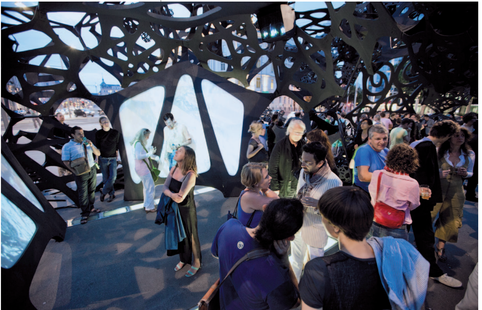
MATTHEW RITCHIE, ARANDA \ LASCH ARUP AGU The Morning Line, 2008–2009. A Thyssen-Bornemisza Art Contemporary szervezésében Schwarzenbergplatz, Bécs, 2011. június 7 – november 20.