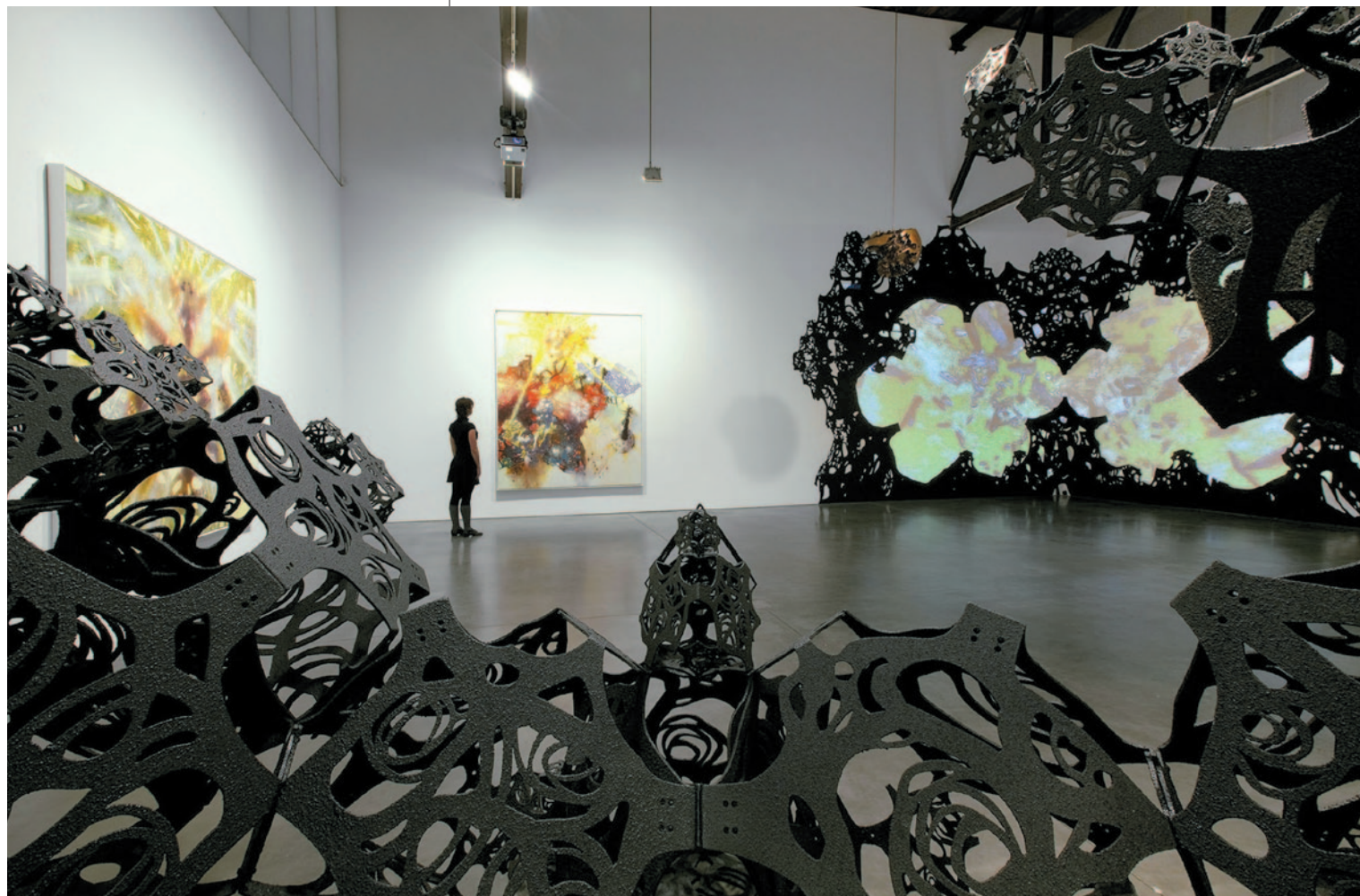
MATTHEW RITCHIE Line Shot, 2009, Andrea Rosen Gallery, New York, 2009. október 23 – december 2., kiállítási enteriőr © Matthew Ritchie. Courtesy of Andrea Rosen Gallery, New York