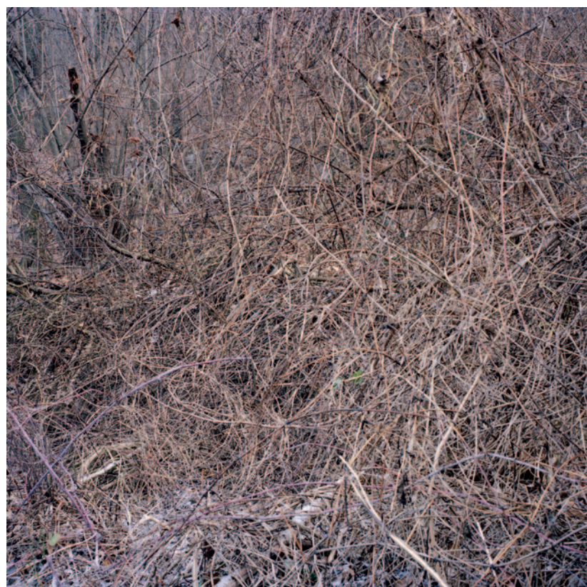
ISKI KOCSIS TIBOR Diósárok 2, 2012, fotó, lambda-print, díbond, 120 x 120 cm

A nagy képeket „ismétlő” kis grafitrajzok sora azonban megszakad: a fotót ábrázoló ceruzarajz „helyett” egy videó szerepel. A médiumok „gyarapítása” új lehetőségeket emel be, használ ki: ismét egy erdő és ismét csak eseménytelen, viszont mozgó képe látható, s ugyanakkor a másolat hiánya a kicsinyítés határait, az effajta másolás lehetetlenségét jelöli ki – negatívan. iski Kocsis különös jelentőséget tulajdonít a munkára fordított és abban testet öltő időnek, 5 amely azonban itt a repetíció ideje is: a visszatérésé, ahogy a videoloop is ismétli a képeket. Ahogy a valóság sem ragadható meg, úgy nincs igazi mozgás, fő esemény vagy motívum e képeken, csak ismétlődés. 6 A festészet határainak kijelölése azonban épp ezáltal sikerül iski Kocsis Tibornak, mégpedig kizárólag perfekcionizmusa révén.