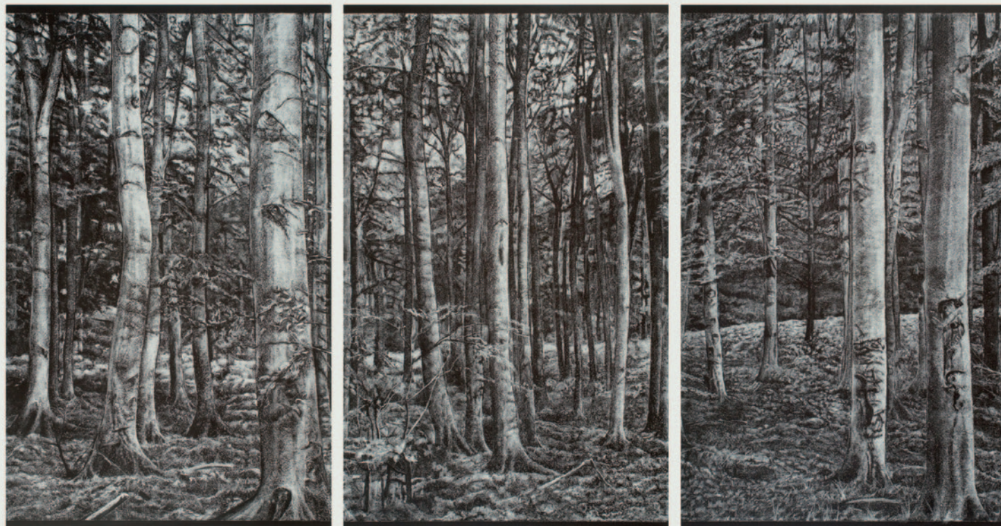
ISKI KOCSIS TIBOR Csurgó, 2011, kréta, fatábla, 220 x 400 cm

A kiállított munkák technikai értelemben szabályos táblaképek, sőt hagyományosak is, amennyiben az alkotó kitar az ábrázolás ilyen-olyan típusú realizmusa mellett. De talán épp a médiumra való koncentráció okán (hiszen nem lehet kétségünk a művész médiumtudatosságát illetően a fotó szerepével, vagy a „természet” közvetítettségével kapcsolatban) a képeknek nincs hagyományos értelemben vett képi struktúrája: közepe, fő motívuma, eseménye. Ehelyett akkurátusan megfestett-rajzolt fák, hullámok, fatörzsek, levelek, ágak és gallyak vannak. E megsokszorozott motívumok szokatlan módon rendeződnek el egy