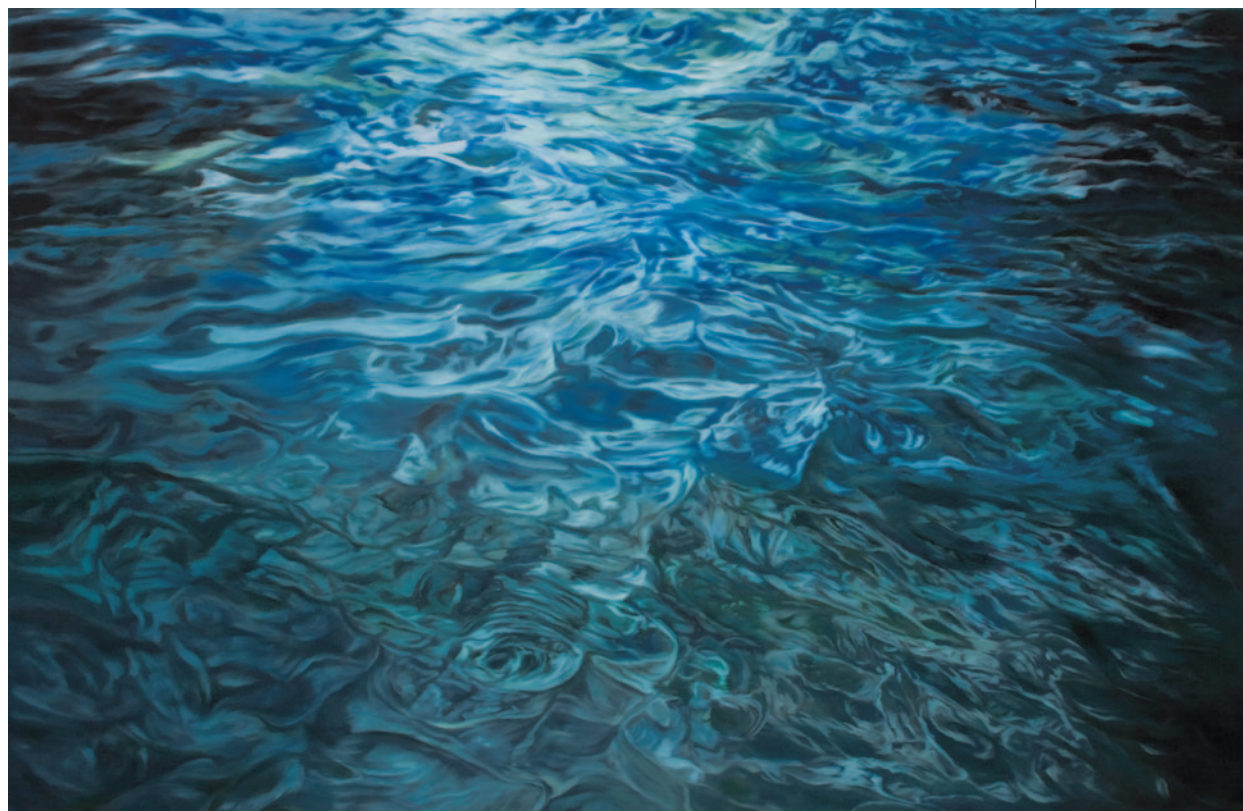
ISKI KOCSIS TIBOR Balatonakarattyá, 2012, olaj, vászon, 142 × 220 cm