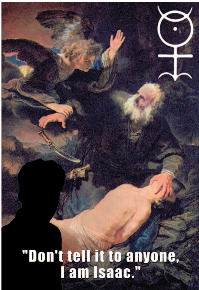
888: Letter to=from Bardo – XIV/7 – Ratinger Hof 01

kán a sátánista pentagramot ábrázoló tetoválást viselő figurát pillantottunk meg, aki a SPIONS frontemberét fixírozta. „A nevem Metatron. 10 ” Metatron közkedvelt figura volt a klubban, rajongói egymás után hozták neki a söröket és spanglikat. Megtudtuk, hogy a Sons of Cain (Káin fiai) nevű blutmetal (vérmetál) zenekar dobosa, lábszárcsontokkal játszik olajshordókból készített dobokon. Egyoldalú beszélgetésünk során – csak ő beszélt – nem vette le szemét a SPIONS frontemberéről. Búcsúzáskor gyűrött névjegyet adott át, és nyomatékosan a lelkünkre kötötte, hogy feltétlenül látogassuk meg.