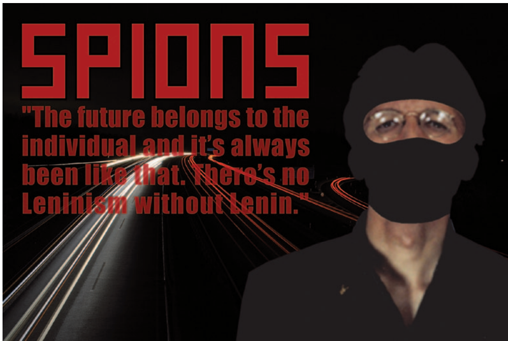
888: Letter to=from Bardo – II/11 – Hommage to Kraftwerk