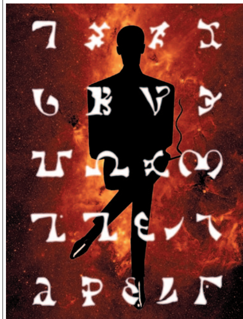
Enoch 01 – Köln 02

a Claves Angelicae (Angyali kulcsok) összefoglaló címet adta, s úgy gondolta, hogy segítségükkel lefordítható a korábban kapott mágikus négy-szögekbe rejtett szövegek mindegyike, egy kivételével. Dee naplójában és Liber Loagaeth című könyvében további lefordíthatatlan szavak ezrei találhatóak, bőséges teret adva az ősn nyelv megértésén fáradozó misztikusoknak mindmáig. A Loagaeth és a Claves Angelicae szövegeinek stilisztikai eltérései miatt sok kutató véli úgy, hogy az ősn nyelv különböző dialektusait vizsgálják.