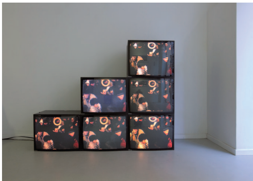
EIKE Spread (Terjedés). 2012, 1 csatornás videó installáció több monitoron