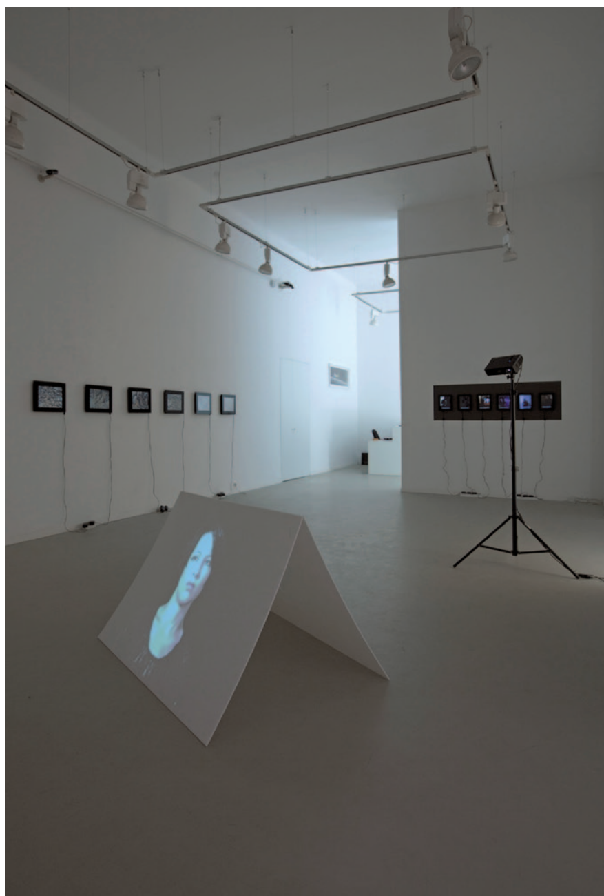
EIKE Kiállításenteriór (Deák Erika Galéria); előtérben: House of Cards (Kártyavár), 2009, 2 csatornás videóinstalláció