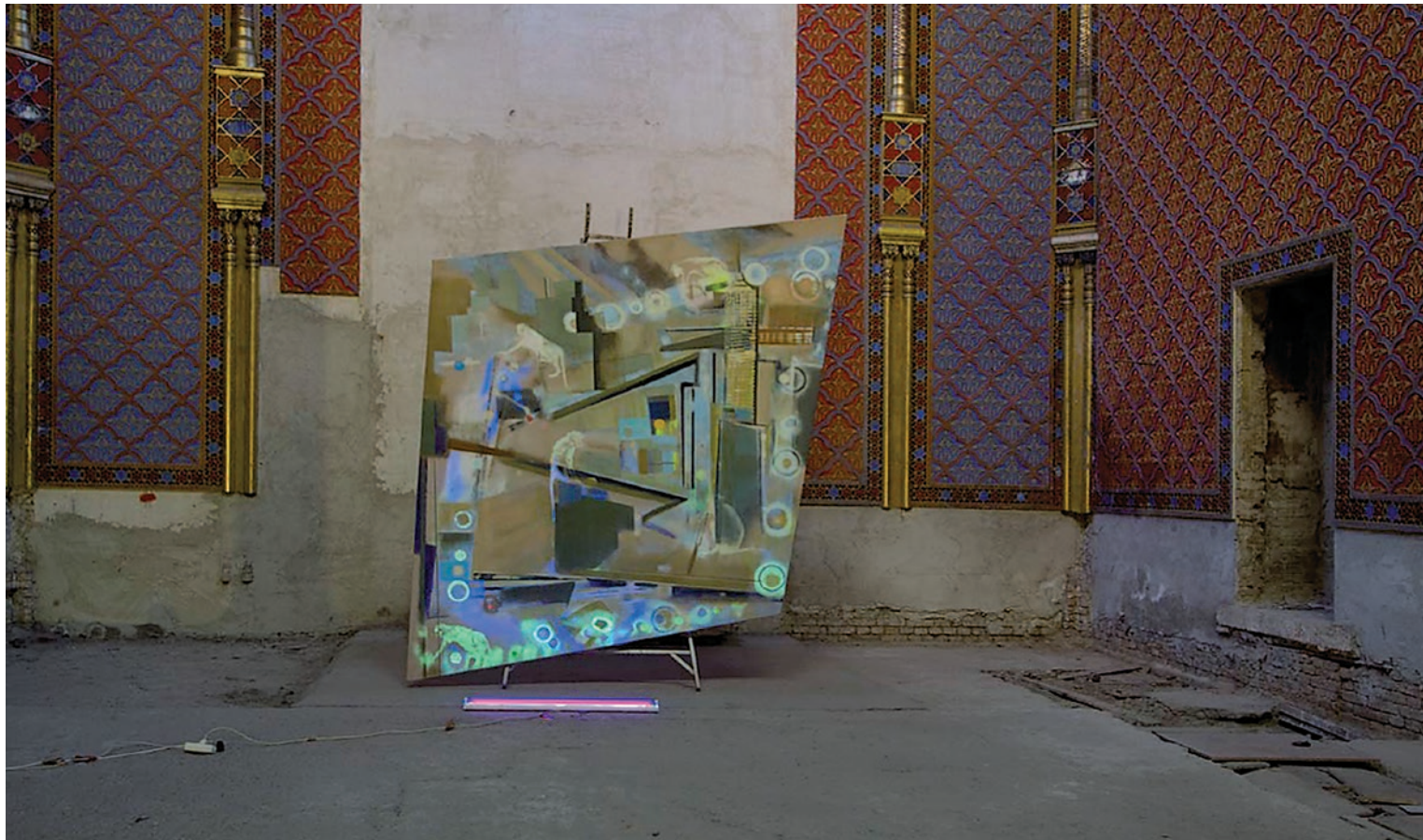
KORODI LUCA Csiki csuki természetes- és UV fényben