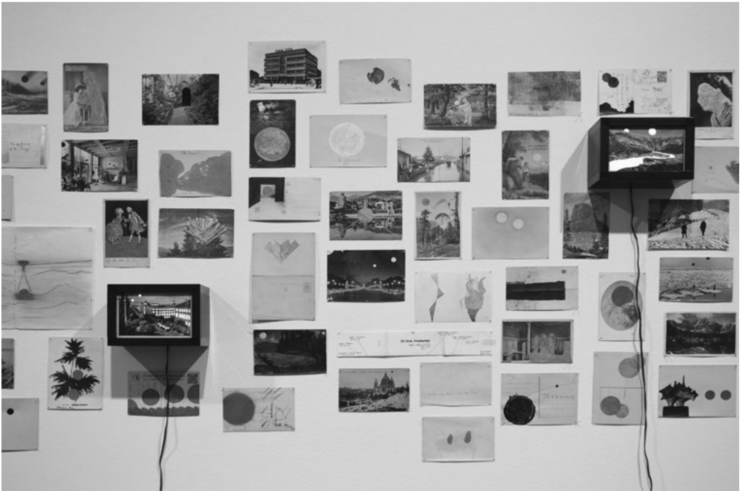
MARCO TADIĆ We Used to Call It: Moon, 2011–2012, részlet