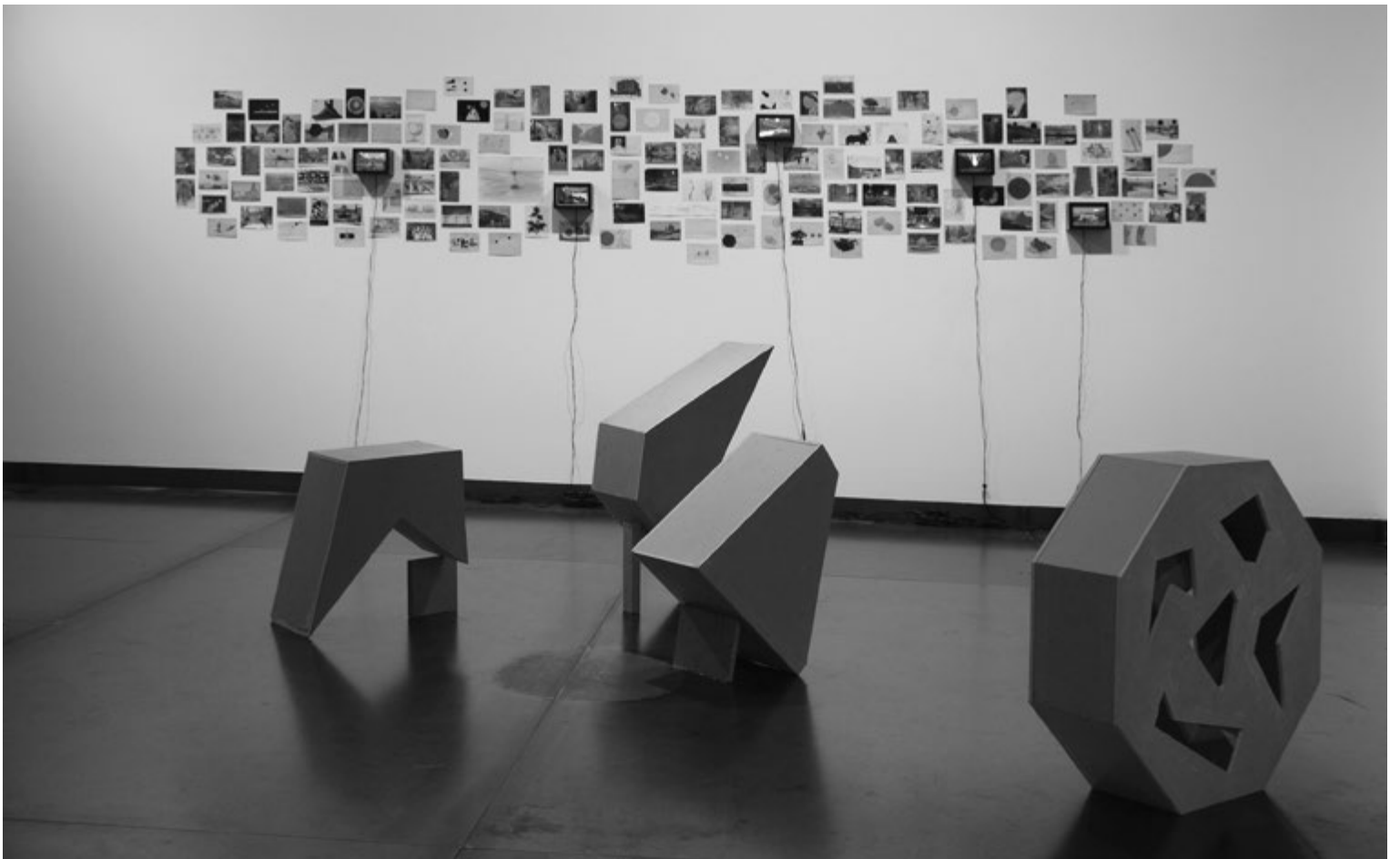
MARCO TADIĆ: We Used to Call It: Moon, 2011–2012, (háttérben) PAVLA SCERANKOVÁ: We Used to Call It: Puzzle, 2009, (előtérben)