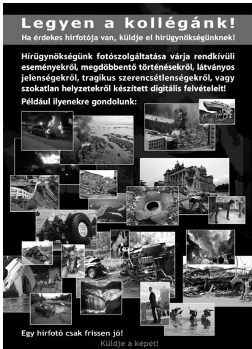
PETŐ HUNOR Küldöm a képem! 2012, print, 100×140 cm