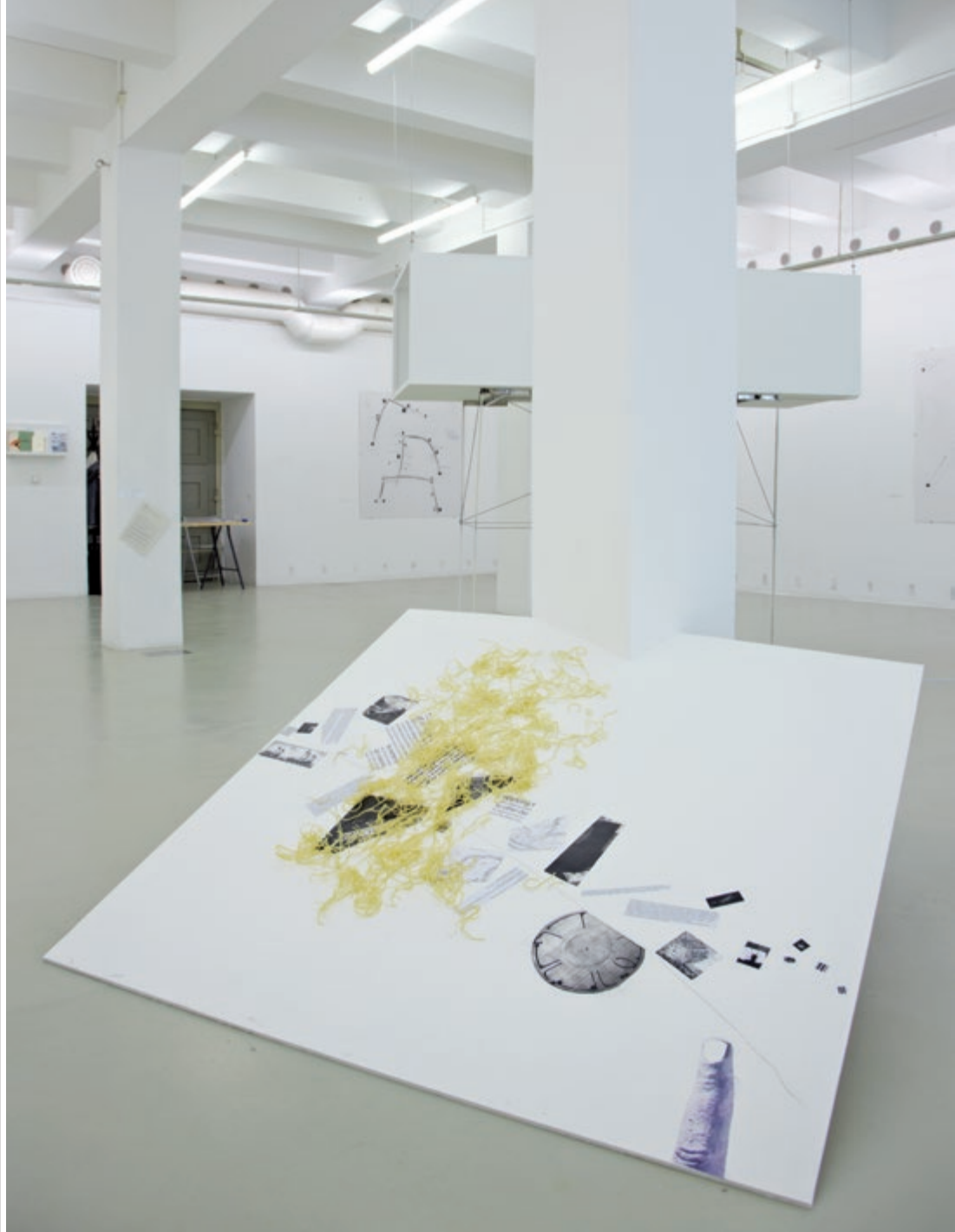
KOMORÓCZKY TAMÁS: Tabló VII. (Gravity), szén, fénymásolatok, tészta fatáblán, 2012