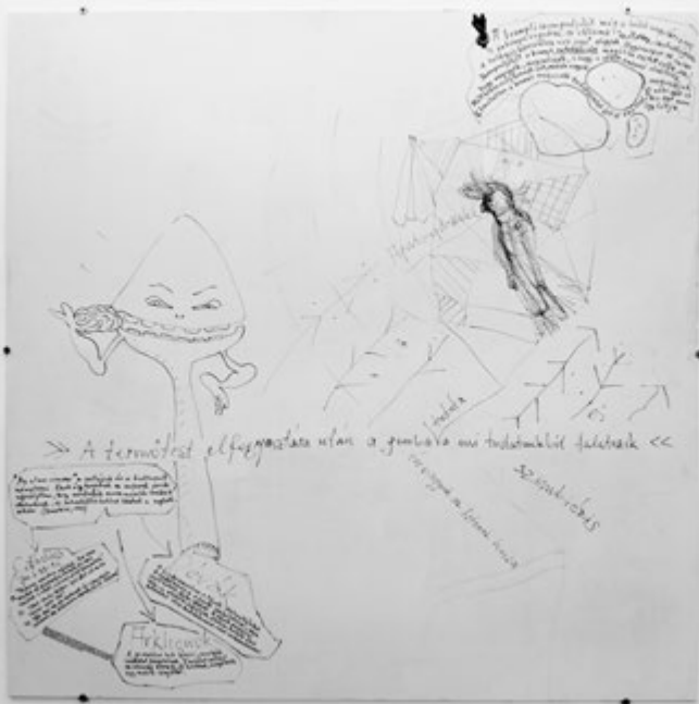
KOMORÓCZKY TAMÁS Tabló III. (Bad Drawing), filctoll fatáblán, 2012

a gnosztikus tanítások világába vezet az Univerzumot leíró és irányító Védák és Arkhonok megidézésével.