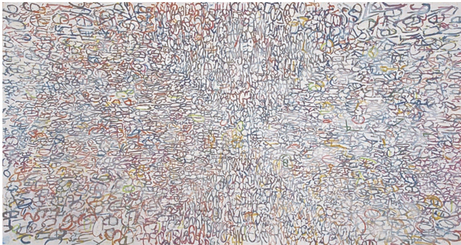
UGLÁR CSABA Cím nélkül, 2012, akvarell, akril, olaj, vászon, 100×190 cm

Ez a koreográfia a konceptuális művészettel rokon: filozófiai, hermeneutikai síkra tereli a festészeti elgondolást, a képi illetékességet, s vívmányait kikezdve, átrendezve extrém jelentéssigénnyel lép fel. Eszményeit, köztük saját szerepét és e szerepből adódó döntési szabadságát is dekonstruálja. Természetesen egyik sem vész el, mindössze arról van szó, hogy néhány processzust Uglár praktikus eszközökre cserél, így növelve meg lehetőségeit az öt foglalkoztató festészeti praxis elmélyítésére. A médiakép tömegtermelése trenírozza figyelmünket, látványvilágunkat, ezáltal szerezzük meg, alakítjuk ki környezetünk, és benne saját önképünk vizuális jellegét. Uglár festményei az ezekből a képfolyamokból kreált elemi részecskék, sejtek, reanimálása tett lírai kísérletek is: amint formát kap ez az imagináció – „áthatol” ezeken a rendkívül dekoratív felületeken – a pop art színvilága és a videóklippek elszánt képostroma is a leképezés és a metanarratíva szolgálatába állítható. A felhasználó vagy user , más területeken szerzett tapasztalataira építve, bővítette az esz-