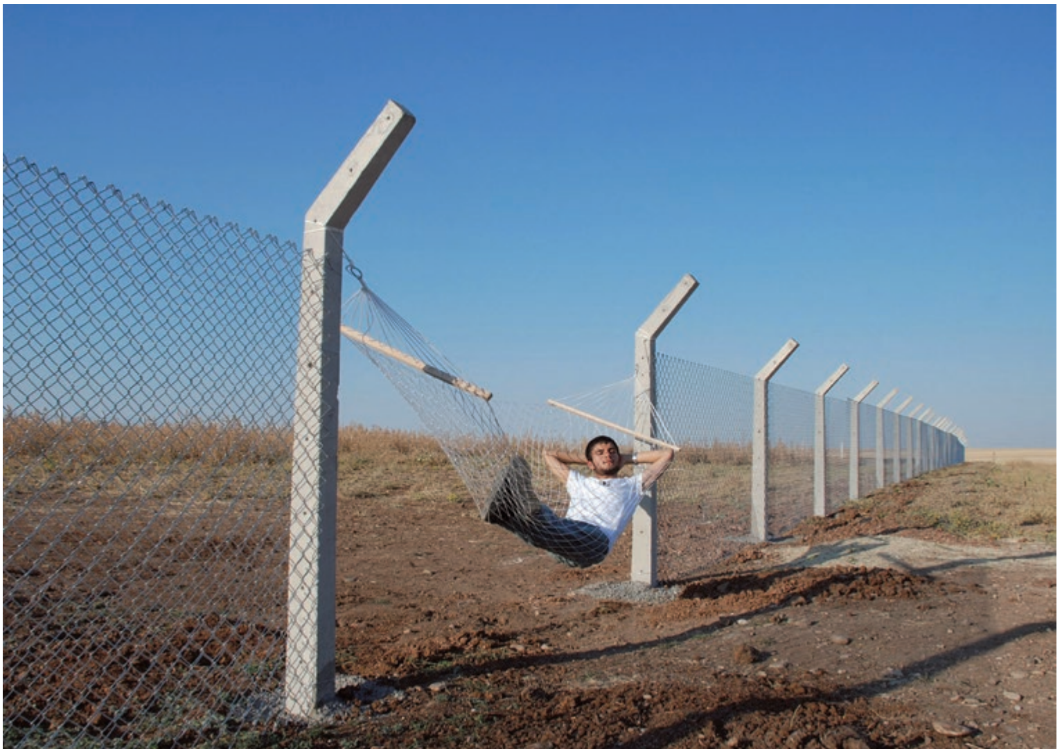
MURAT GÖK Border (Hammok), 2010