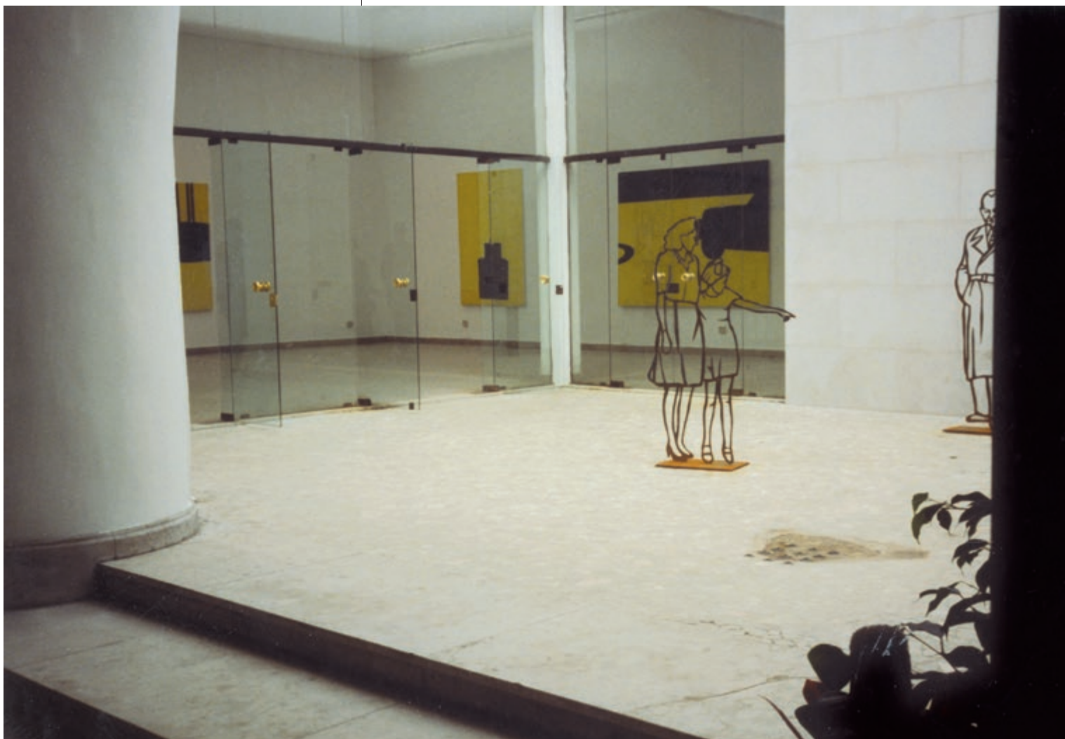
Kiállítási enteriőr a Magyar Pavilon átriuma felől. Magyar Pavilon, Velence, 1990