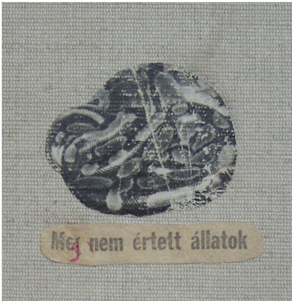
CSERNE LÁSZLÓ Meg nem értett állatok (részlet a könyvből)

el kell fogadnunk, hogy akkor különös ereje volt és valós érdeklődésre tartott számot.