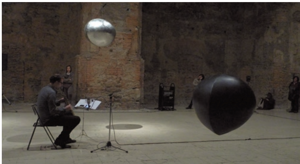
TURCSÁNY VILLŐ Inga-hangolás, BTM Fővárosi Képtár – Kiscelli Múzeum, templomtér Christian Kobi-Michael Szedlák: Zene Inga-hangoláshoz

kák zeneileg komponált mozgását csak az installálás során lehetett beállítani – egyesével, folyamatos rögtönzéseként, kísérleti úton. A részciklusokból felépülő „loop” – a teljes ciklus – 32 perces lett.