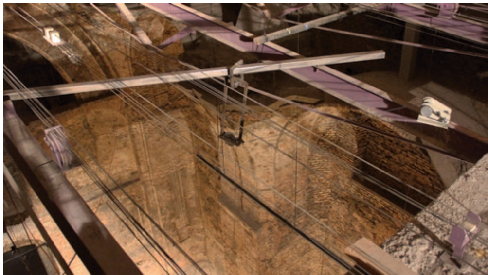
TURCSÁNY VILLŐ Inga-hangolás, BTM Fővárosi Képtár – Kiscelli Múzeum, templomtér felső nézet, mozgató szerkezet

„harangnyelvek” látványa teremtette meg. Mozgásuk ugyanakkor a falakon megjelenő ívek rendjét is visszhangozta. A precízen komponált átlók a teljes teret játékba vonták, a folytonosan mozgó struktúra az idő érzékelését megváltoztató, polifonikus kompozícióként hatott a nézőkre – a reális időbeliség kereteit megszüntetve. Ugyanakkor a mozgás érzékelése is feloldódott: a térben helyet változtató néző folyamatos nézőpontváltása közben az installáció folyton áthangolta a befogadó teret, átmeneti téri viszonyokat létrehozva. A négyes (quartett) szoborcsoport térbeli ritmusképletei és az ingák által bejárt pályák megteremtették az építészeti struktúra együtthangzását a mozgással.