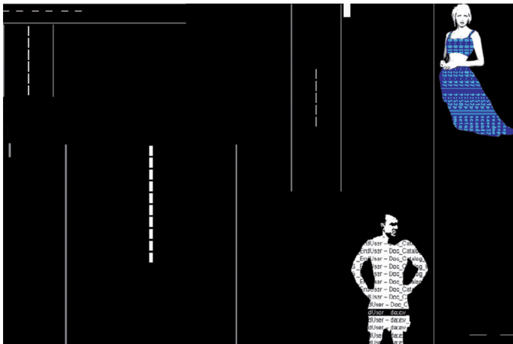
OLIA LIALINA Agatha appears (Agatha feltűnik), 1997, http://www.c3.hu/collection/agatha/