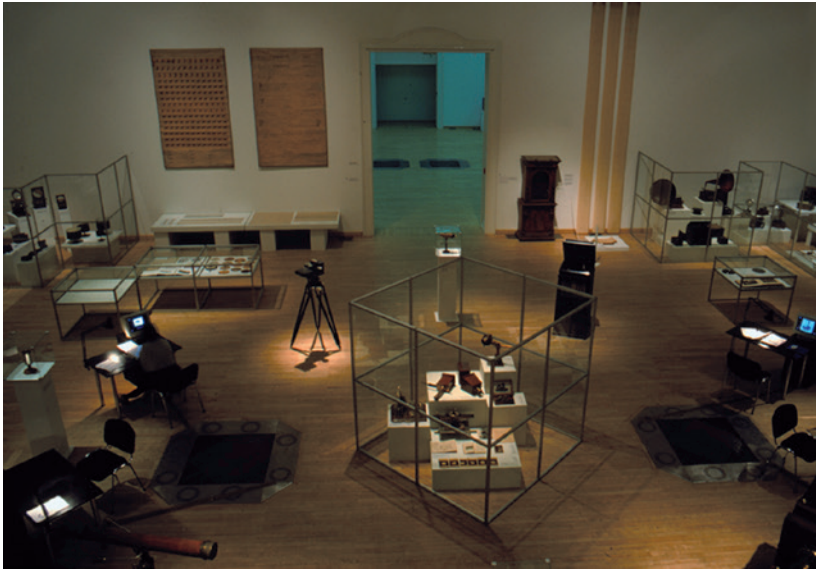
A pillangó-hatás című kiállítás részlete: Média relikviák. Múcsarnok, 1996

kontextusában vállalkozik. A jelen felől s a jövő számára mutat fel – összhangban a hasonló nemzetközi törekvésekkel – egy új és jórészt ismeretlen kulturális corpust, mely néhány év alatt, a megvalósulással szinkronban nemzetközi jelentőségű, kikerülhetetlen forrássá válhat.