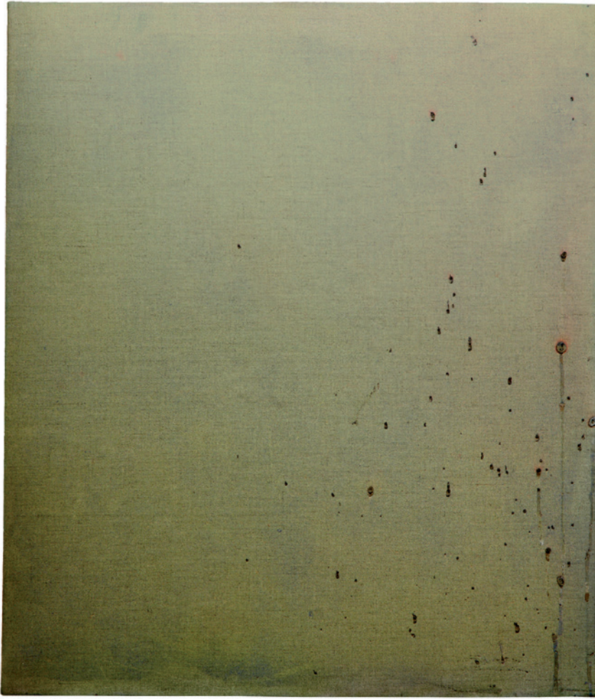
NAVID NUUR A monokróm tanulmányok szemkódexéből (Füst tanulmány), 1988–2013, feszített vászon, gesso alapozó, füstbomba, pigment, videó-loop mobiltelefonon, 55 x 60 cm

amit az ipar feliratok és logók létrehozásához használ, de mindezt a művészetbe alkalmazni lőtúró, vagy egyszerűen csak régimódi. Ahhoz, hogy túl legyek az egész neon-irritáción, először készítettem három neonmunkát.