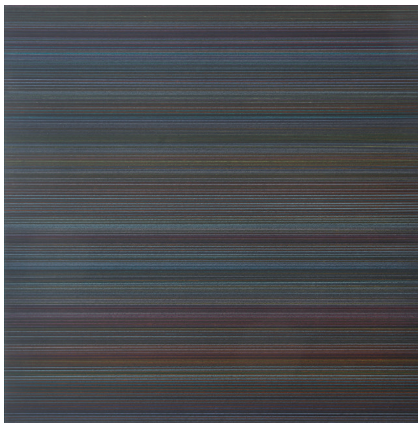
JOVÁNOVICS TAMÁS 'Looking through the window or looking at the window?', 2012, ceruza, MDF lap, fixált és lakkozott, 110 × 110 cm

rendszeren belül minden felhasználható változóval a lehető legtöbb permutáció létrehozása. Keserü képei ugyan optikailag zártak, de a jeleken keresztül nyitnak a néző felé. A cél a kommunikáció megteremtése: két jel, az egyes jelek és a néző, illetve a jelek halmaza és a befogadó között. A nyers vizuális impulzus jelentőségteljes jelekké való formálása, megtalálva a rendezetlenségi maximum és a rendezettségi minimum egyensúlyát (Umberto Eco).