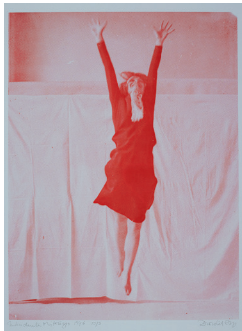
DROZDIK ORSOLYA Individuális mitológia, Ugrás, 1976, ofszet, 68×50 cm

a történetírás (női nézőpontú) kritikája – egy, az idősebb generáció által a fluxus és konceptuális művészet közvetítése során megszülető paradigmaváltást jelentett. Orshi Individuális mitológiája a főiskolás évek küzdelmein, a szabadság égető hiányán és a művészi identitáskeresésén túl arról is szól, hogy a kollektív történelem helyett saját, egyéni, mikroelbeszélés írható. A cenzúrázott művészetet, a modernizmus cenzúrázott elméleteit keresve és az ártít történelem hiányzó része után kutatva a nyugati elméletekhez fordult, és hamarosan Amszterdamba, majd Torontóba ment, utána pedig az Egyesült Államokba költözött.