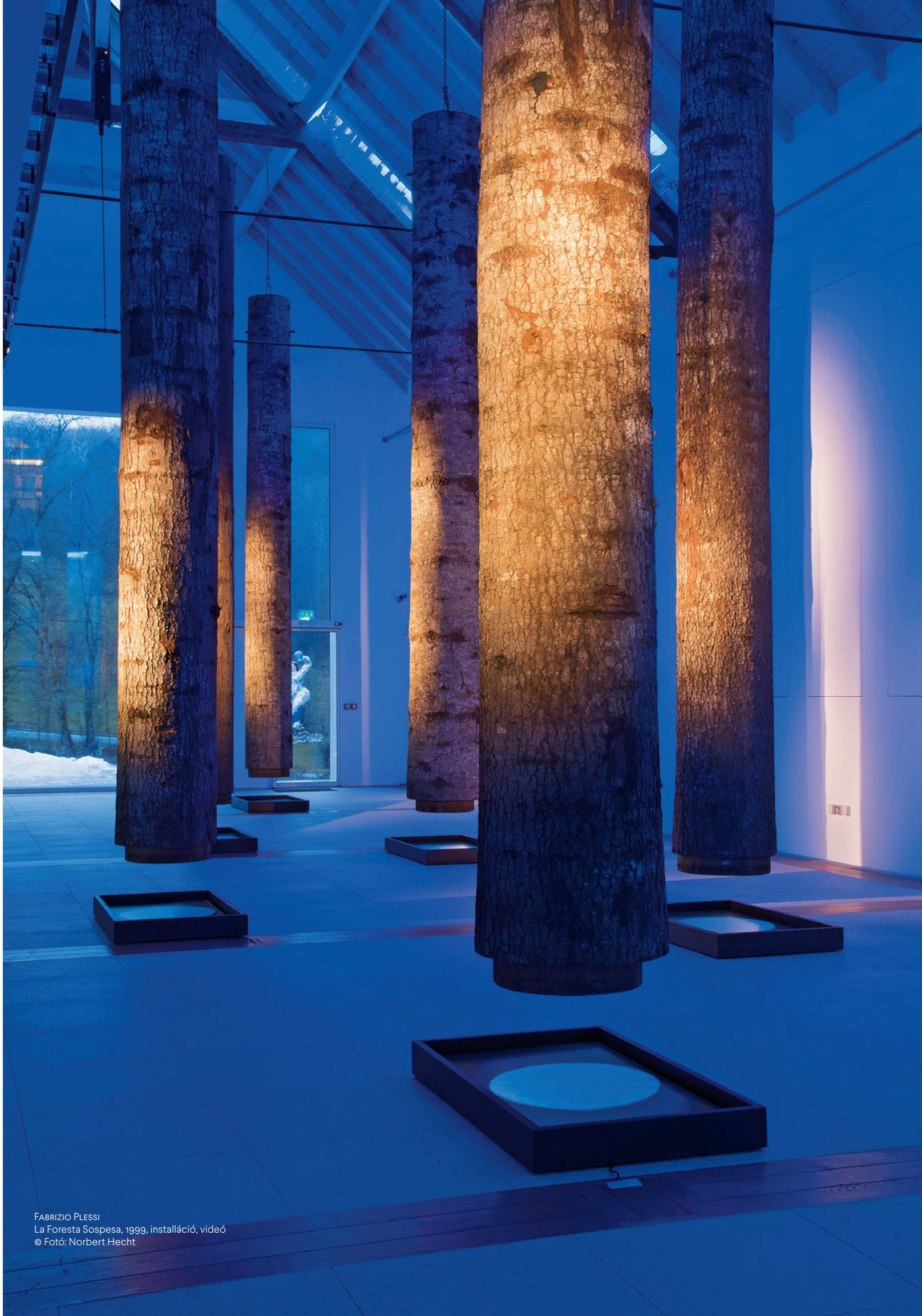
FABRIZIO PLESSI La Foresta Sospesa, 1999, installáció, videó