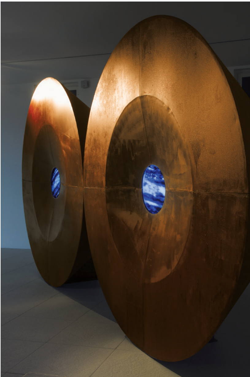
FABRIZIO PLESSI Water Circles, 1981, installáció, videó

is, a természet és a technológia összefonódik. A mennyezeti gerendákra függesztett, hat méter hosszú, oszlopszerűen sorakozó kivájt fenyőtörzsek a hangeffektusokkal és az aljuk vetített mozgó víztócsákkal azt az illúziót keltik, mintha egy esőzattal, varázslatos erdőben sétálnánk, amelyben megállt az idő. Az alagsori félhomályban mintha két óriási szem keresné tekintetünket: a Water Circles (1981), amely a statikus és dinamikus, az élő és élettelen, a folyékony és szilárd szimbiózisa. Képzeljük el két, egymást éppen csak érintő geometrikus formát, két hatalmas, két és fél méter átmérőjű, kör alakú vaskorongot, közepükön egy-egy, ugyancsak kör alakú nyílásokban videón vetített, állandó mozgásban lévő víztömegeg. A Water Wind (1984) gerince egy acéltömb, egyik végén egy szelet fújó szerkezettel, a másikon egy képernyővel, amelyen a szél által borzolt vízfelületet látjuk. „A természetes elem megfertőzi és megváltoztatja a mesterséges képet. Ez a legmélyebb és felkavaró magyarázata ennek a ma már művészettörténeti műnek. A hamis valódibb, mint az igazi” – írja kísérszövegében a művész.