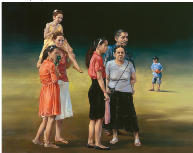
BÁLINT ISTVÁN Család / Família, olaj, vászon, 80×100 cm, 2013