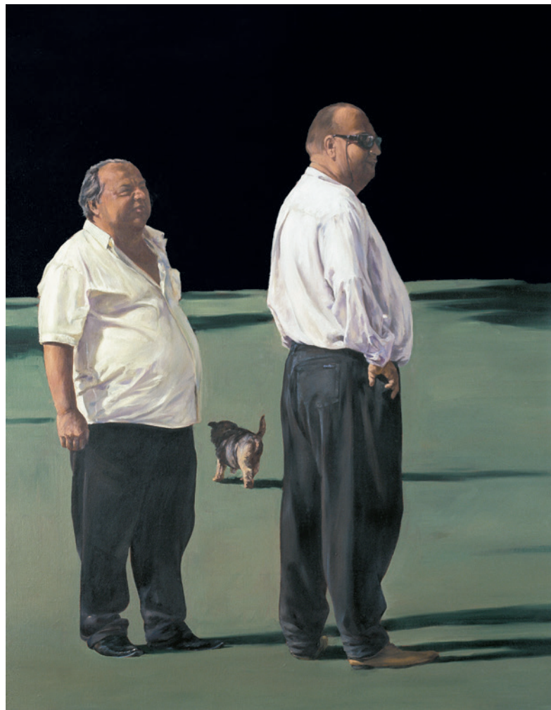
BÁLINT ISTVÁN Mindketten / Lotar, olaj, vászon, 90×70 cm, 2013