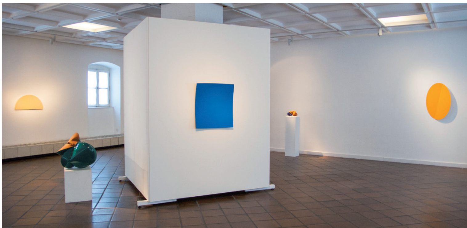
MÜLLER-EMIL: work, 2014, akril, mdf, 42×81×3 cm Heiner Thiel, C.n. 2014, eloxált alumínium, 71×65×8 cm JEREMY THOMAS: Neve Blue, 2013, acél, körömlakk, 21×28×17 cm

elemi egyszerűség és új képi, formai, térbeli plasztikai egység állapotának az eléréséhez (legkomplexebb példa JOVÁNOVICVS TAMÁS munkája). Minél plasztikusabb, kerekdedebb, ívesebb a forma, annál fontosabb színfelületének, színteste kontinuitásának a megszakítása, a forma testiségének, térbeliségének a tagadása, a szín plasztikai értékének a növelése. S minél tagoltabb vagy képszerűbb a forma, annál inkább szükséges a szín formaképző erejének, lehatároló képességének a korlátozása, a színfelület kontinuitásának biztosítása. Tér és test, forma és felület, szín és plaszticitás, zártság és nyitottság, térbeliség és képszerűség egymás ellenében végül közbülső formává, új médiummá válik, összetettebb valóságot teremt.