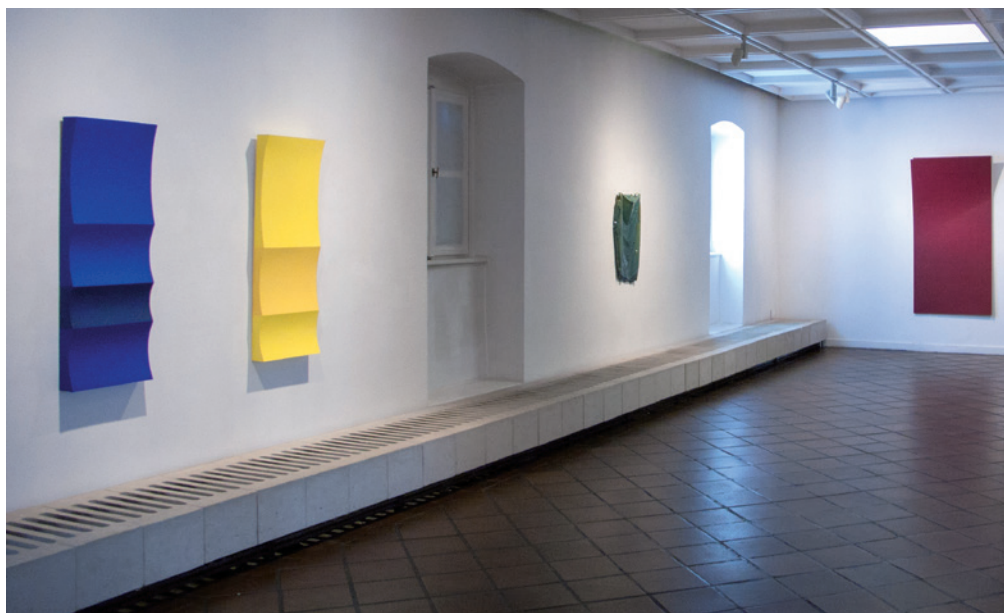
ANN REDER: HAV kék, 2013, rétegelt lemez, olaj, 126×444×19 cm és HAV sárga, 2014, 126×46×9 cm; EDUARD TAUSS: Akasztás, 2012, poliuretán, pigment, 130×46×14 cm; JOVÁNOVICS TAMÁS: Summer Palace, 2006, polisztirol, akril, 200×100×30 cm