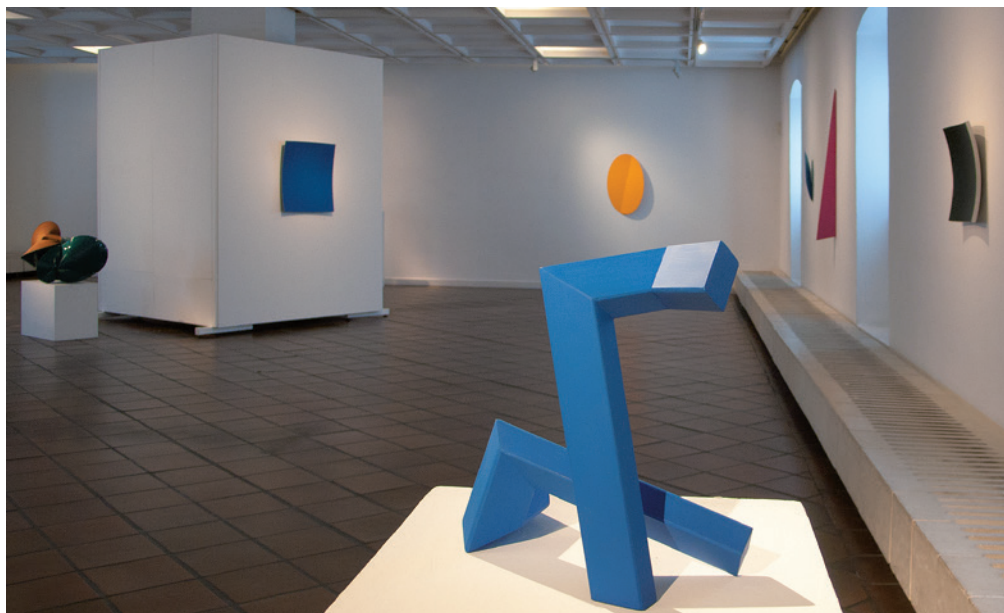
elől: GÁYOR TIBOR: Memento 1956, 2006, fa, akril, modell, 50×41×30 cm; hátul balra és jobbszélén: HEINER THIEL, C.n. 2014, elo×ált alumínium, 71×65×8 cm, és C.n. 2009, 50×45×10 cm; középen: MICHAEL POST: C.n. 2014, üvegszál, acél, akril, 89×55,4 cm

Bennük a szín és a forma, a szellemi és a fizikai, az érzéki és a konkrét egymástól elválaszthatatlan egységet alkot mind a mű elgondolásakor, mind a mű megvalósításakor és megjelenésében is. Minden elem és mozzanat abszolút egyenrangú egymással, ugyanakkor egymásmellettiségük,