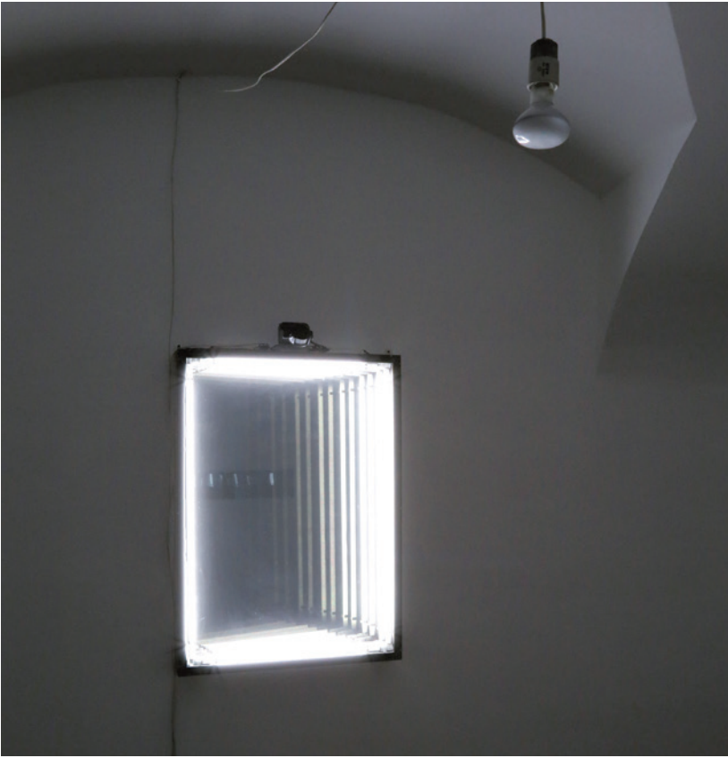
HALÁSZ PÉTER TAMÁS Egy part fényei, 2008

arról az ikonológiai kérdésről van szó, amint a zombifilmek kötelező motívuma, a bedeszkázott ablakok képe a jelennel, a világ tájain folyó harcokról közvetített képekkel folyik össze. Napjaink „valódi” háborúi nyíltan és elismerten a számítógépes lövöldözős játékok igazabb élményt nyújtó verzióivá váltak az Öbölháborútól az IÁ terjeszkedéséig. A Triptichon (2014) kulcsmotívuma, a deszkák részébe állítandó géppuska ( Szupremácia , 2014) – amely itt még csak építés alatt várja bevetését – visszatérő kérdések konstrukciója, „egybeszerkesztése”. Szuprematista formavilága egyértelmű utalás az utópisztikus orosz konstruktivizmus alig megvalósult, soha sem látott új világára, de egyben célzás a nagyon is megvalósult és szinte alig megváltoztatott, évtizedek óta folyamatosan gyártott, szintén orosz fejlesztésű AK-47-es gépkarabélyra is. Ez ismét kioltásnak tűnik inkább, mint harmadik elmének, amit a kétértelmű RGB-nek és KGB-nek olvasható, villogó hátterű deszka-kezdőbetűk is csak részlegesen nyitnak föl.