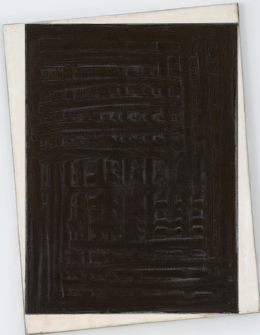
KÁROLYI ZSIGMOND Étalon, 1992, olaj, vászon, 80×60 cm