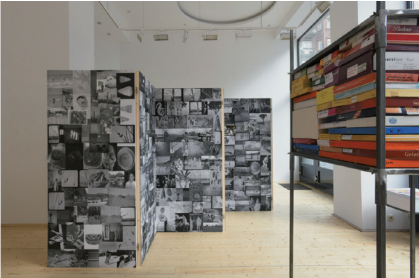
PETRA FERIANCOVÁ Sérülékeny, mégis örök (Květa Fulíerová archívuma) 2015, installáció, részlet