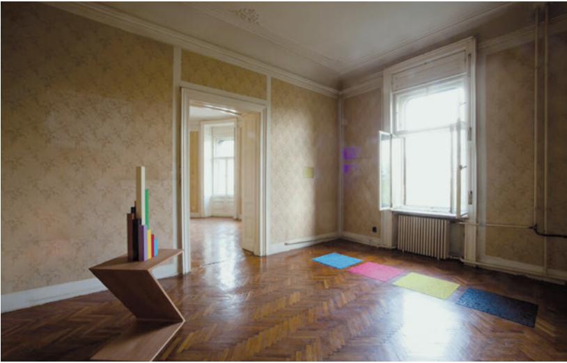
KIS VARSÓ Tevőleges, 2015