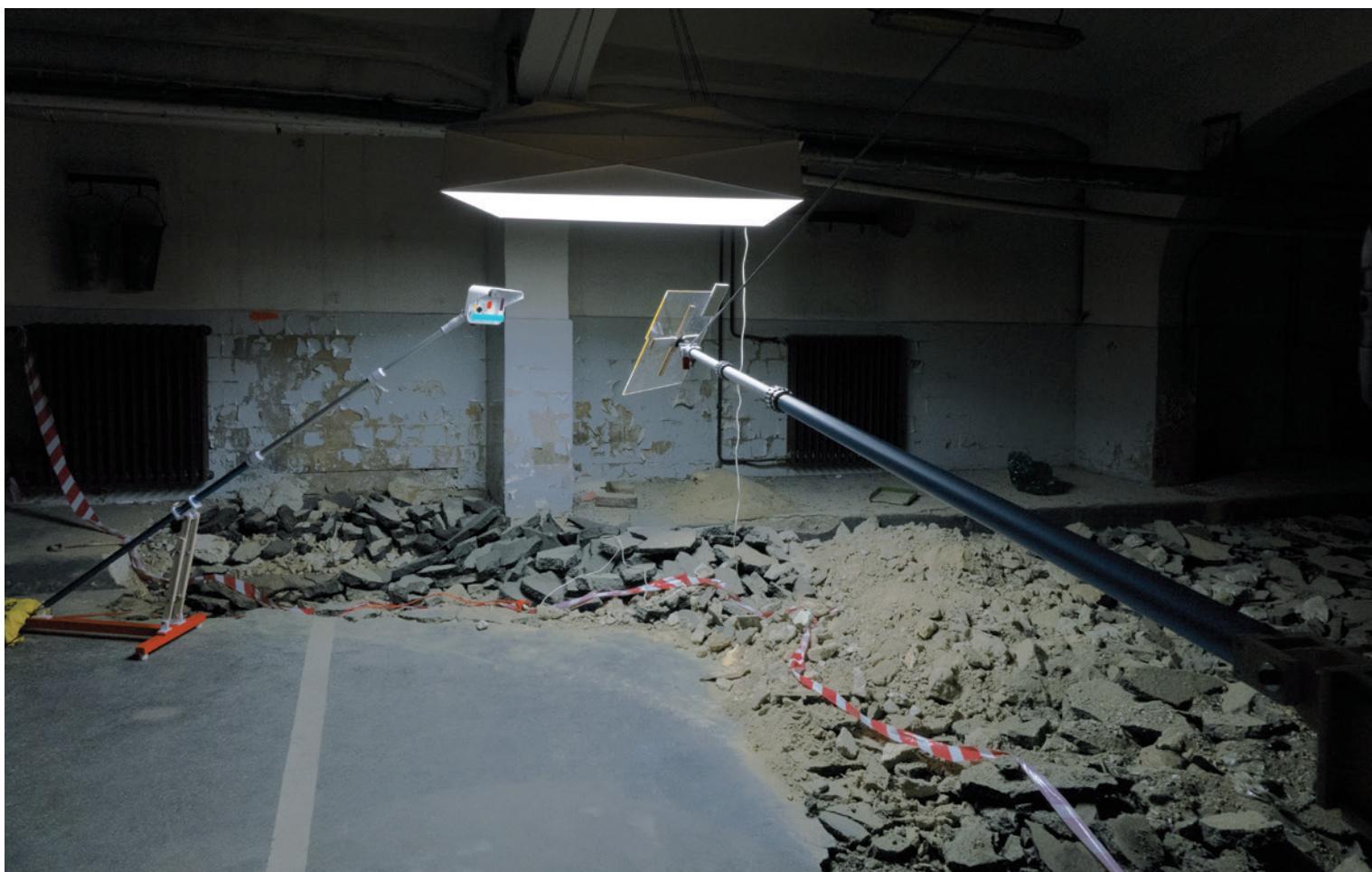
Kokesch Ádám Cím nélkül, 2015, installáció (részlet) | Izolátor. Volt Postapalota