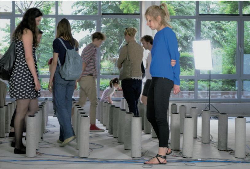
GRYLLUS ÁBRIS installációja, 2015 (részlet) Sound as Space I Budapest, Central Passage

fotókat és ő is fotózta őket: itt az ideje tehát, hogy ezeket állítsuk a középpontba. A Kreativitás & Vizualitás 1975–1977 című kiállítás 31 a Ganz MÁVAG Művelődési Ház, tehát egy állami intézmény, alternatív művészeti oktatási műhelyének dokumentumait állította ki, és így a hatalom és a neoavantgárd viszonyának egy további aspektusát érzékeltette.