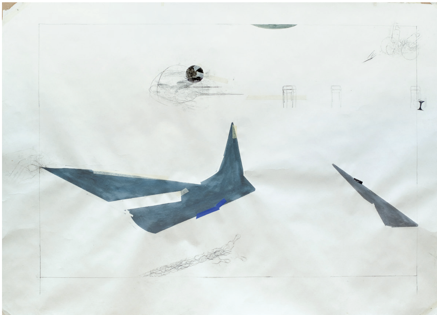
TIBOR ZSOLT u boot, 2002/09, grafit, gouache, tus, plectol es ragasztoszalagok, papiron, 138×188 cm