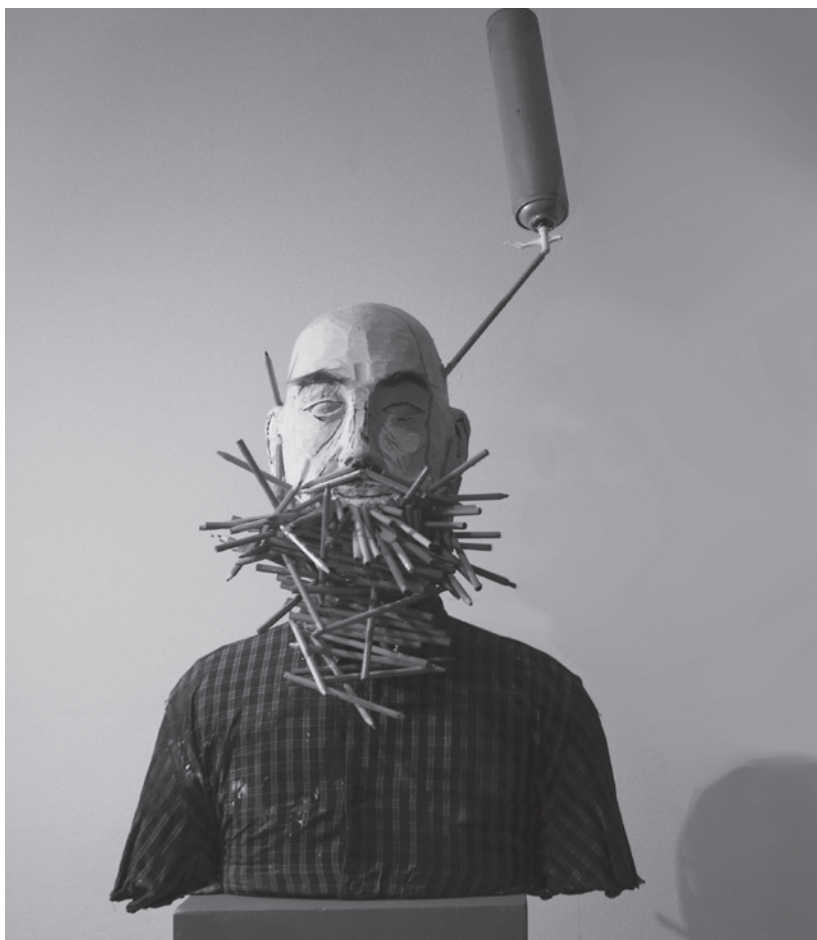
ORDÓDI TAMÁS Sejtettem (the foreknowledge), 2015 keményhab, és objektumok, 80 × 63 × 42 cm

már olyasmi is elfoglalhatja ezt a kategóriát, mint a légies, szerves, sőt undorkeltő madár-fekália. Hol van már az „örök” kőben rejtekező kép antik mítosza, miszerint a nemes anyagban megbúvó ideális kép kiszabadítása és az időtlenségnek való felszentelése lenne a szobrászművész feladata?