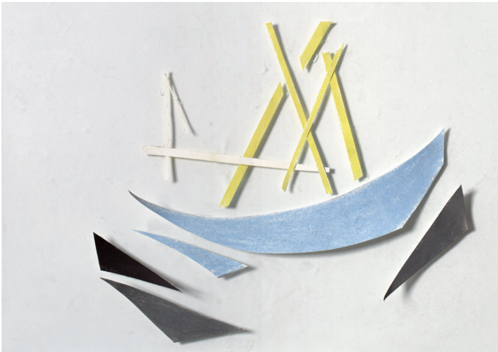
KORODI LUCA XXI. sz., papír, üveg, pasztell, 25 × 37 cm

nagyon is tapintható, szinte tektonikus felszín, amely mégsem a faktúra felszíne, hanem valahol a távolban van, amelyen jelzésszerű fények csillogását látjuk. Ezután következik a végső, immár tisztán texturális alkonyfázis, az elmosódó foltokkal és a szétszórt fénytel teljesen elkeveredő, összeszövődő felszín, amelyre a 4. számú kép lehet a legjobb példa, sőt az önmagába mélyedő, még a konkrét külső fényt, a kiállítóter fényét is abszorbeáló felszín, amilyen a 3. számú képnél látunk. Ha követtük ezeknek a fázisoknak a logikáját, rájövünk, hogy ez a szőnyegpadlóra készült kép egyáltalán nem a faktúra felbukkanásáról szól, épp ellenkezőleg, ami itt igazán történik, az a textúrának a visszahúzódása, önmagába mélyülése. Ez az alkony utolsó fázisa: a láthatónak és a tapinthatónak az egyidejű elutasítása, amely mégis sűrű anyagiságként létezik. Ezután már csak az éjszaka jöhet, a térnélküliségben felszínre való sötétség.