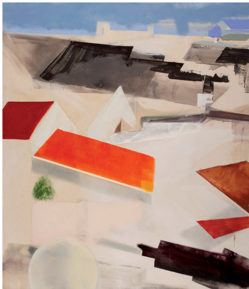
KORODI LUCA Alkonyat fázisai o., olaj, vászon, 150 × 140 cm

Mindannyian ismerjük a költői képzetnek azt a valószínűleg a köztudatból/ közképletből származó termékét, amely szerint az este valami olyasmi lenne, ami fentről, az égből érkezik, hogy szó szerint sötétségbe borítsa, sötéttséggel borítsa be a világot. „Midőn az est e lágyan takaró / fekete, síma bársonytakaró, / melyet terít egy óriási dajka, / a féltett földet lassan eltakarja” – kezdi Babits az Esti kérdés című versét. Vagy másképp: „Mostantól az este érkezik, / gongütésre ránk ereszkedik” – írja Bereményi Géza a Sárga gong című gyönyörű Cseh Tamás szám szövegében. S még ha kicsit lejjebb szövődik is ez a bizonyos takaró, egy dolog biztos, hogy nem a felszínen: „Hálót fon az est, a nagy, barna pók, / nem mozdulnak a tiszai hajók” – ahogy Juhász Gyula írja