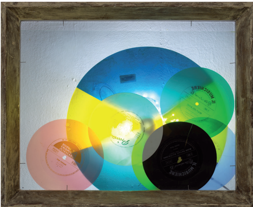
KORODI LUCA Delaunay triangulum, vinil, üveg, led, 60 × 90 cm