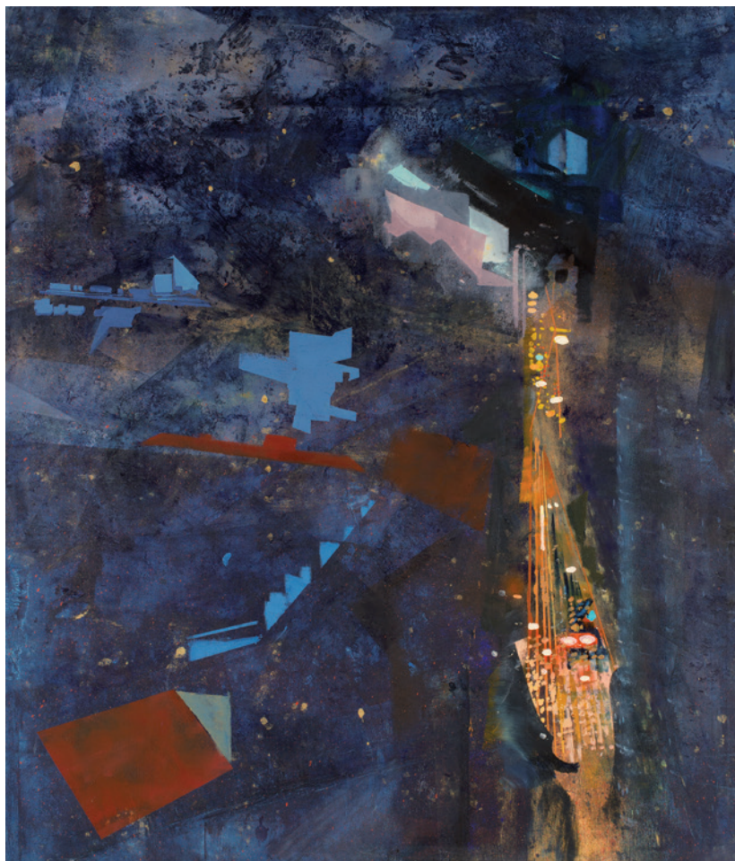
KORODI LUCA Alkonyat fázisai 3., olaj, vászon, 150 × 140 cm