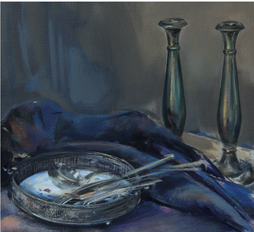
ZOLTAI BEA Péntek este IV. olaj, vászon, 52 x 55 cm

elsősorban gesztusfestészetre, mely Jackson Pollocknál ered az ötvenes években. 2 Írhatunk a festményekről a magyar festészeti hagyományok szempontjából, figyelembe véve különösen a dunaparti plain-air festők színvilágát – például Ferenczy Károlyét – és témájukat, a fény rezgését a Dunakanyar felett; egy olyan természeti jelenséget, melyet a képeken felfedezni vélek.