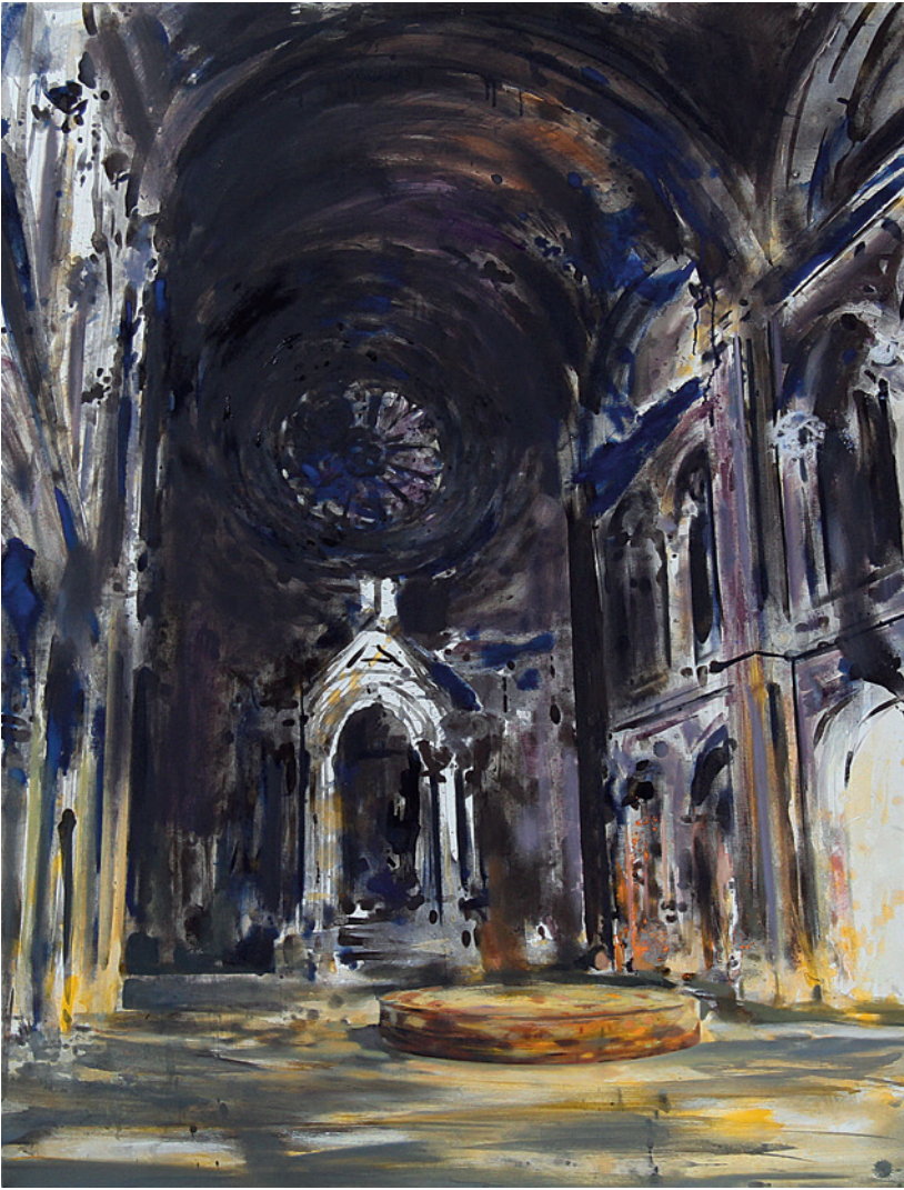
ZOLTAI BEA Kiüresítve III. – A mennyezetig ér a feszítő, súlyos csend. Hűvös, mélységes, körbeölel. Járok benne. 120 x 100 cm, vegyes technika, vászon