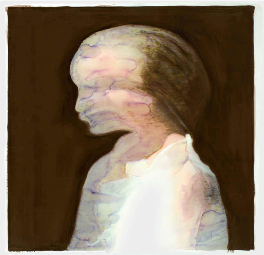
CSURKA ESZTER Cím nélkül, 2015, akvarell, tinta, 54 × 54 cm