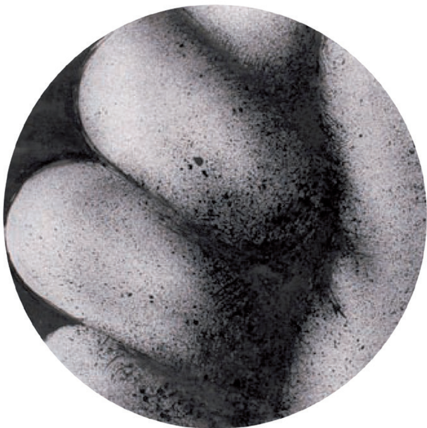
BARANYAY ANDRÁS Kéz részlet, 1970, litográfia, ø 36 cm

sem várná el, hogy egy sokalakos elbeszélő kompozíció valamennyi alak kezé-lába világosan kirajzolódjék, s még a klasszikus stílus sem értelmezte így a követelményt, mégsem elhanyagolható körülmény, hogy Leonardo Utolsó vacsoráján Krisztus és a tizenkét tanítvány huszonhat keze közül egyetlen egy sem »hanyatlík az asztal alá«. És északon ugyanez a helyzet. Ellenőrizhetjük ezt Massys antwerpeni Siratásán , vagy megszámlálhatjuk a végtagokat Joos van Cleve (Mária halálának mestere) nagy Piétáján : valamennyi kéz jelen van, és az északi művészetben ez még nagyobb jelentőségű, hiszen ilyesféle tradíció itt nem szolgált előzményül. Ezzel szemben jellegzetes ellenpéldaként hozhatjuk fel Rembrandt oly tárgyilagosan megkomponált csoportos képmását, amilyen a Staalmeesters : ezen a festményen a hat alak tizenkét keze közül csak öt látható. Ekkor már a hiánytalanul ábrázolt jelenség a kivétel, vagyis éppen az, ami azelőtt a szabály volt.”